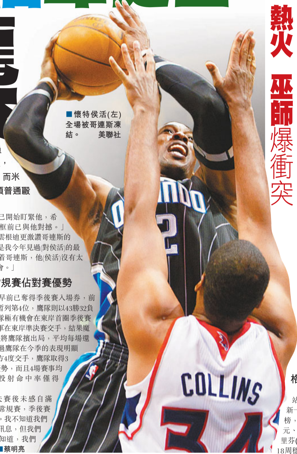
懷特侯活(左)全場被哥連斯凍結。