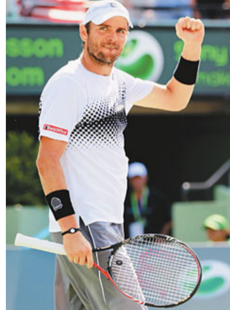
費殊殺入4強兼做美國一哥,可喜可賀。

女單方面,上屆冠軍的比利時球手克利施達絲(阿金)在8強則意外以直落2盤3:6不敵白俄羅斯球手阿薩倫卡出局,宣告衛冕失敗。阿薩倫卡的準決賽對手是3號種子的俄羅斯球手施禾娜莉娃。