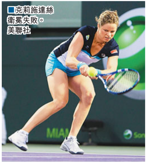
克利施達絲衛冕失敗。

已屆29歲的費殊在周三的邁阿密公開賽男單8強,以直落2盤7:5和6:2擊敗現世界排名第6位的西班牙名將費拿,勇闖準決賽,而且還藉此超越同胞盧迪克,首次成為美國男網「一哥」。