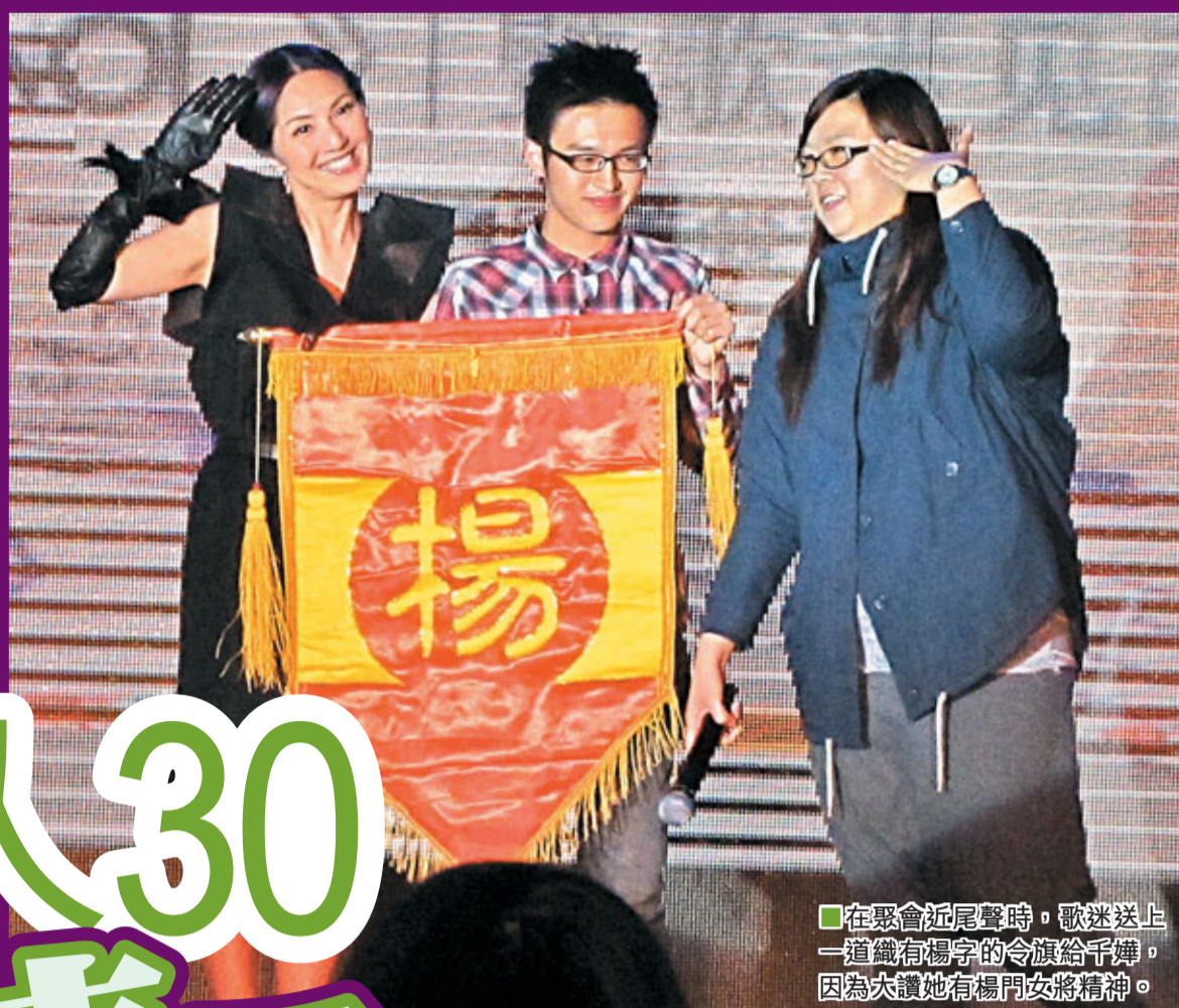
■在聚會尾聲時，歌迷送上一道織有楊字的令旗給千嬅，因為太讚她有楊門女將精神。

香港文匯報訊 (記者 植植) 楊千嬅早前到北京，為新出國語碟舉行大型宣傳活動。今次千嬅是首次在北京發國語碟，藉着這次機會千嬅特別安排一個歌迷聚會，約有400名歌迷一早到場準備入座，在場地門外有4個1:1的千嬅人形紙板公仔，本來千嬅也想將4個紙板公仔搬回港，不過因為搬運麻煩，最後也打消念頭。