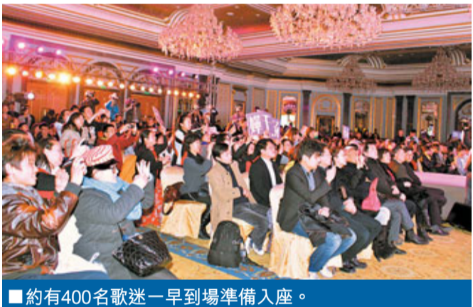
■約有400名歌迷一早到場準備入座。

又有歌迷問到千嬅最溫馨、溫暖的感覺是甚麼？千嬅認真地說：「與家人一齊時候最溫暖，他 (丈夫) 在我最累的時候送上一句問候是最溫馨，因為令我很有安全感。」歌迷們即時大拍手掌。千嬅又指她十分喜歡陳百強，因為陳百強是天生帥哥又有才華，若與他談情說愛是一件開心事。又有人問：「丁生