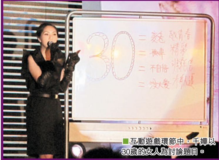
■互動遊戲環節中，千嬅以30歲的女人為討論題目。

香港文匯報訊 (記者 植植) 楊千嬅早前到北京，為新出國語碟舉行大型宣傳活動。今次千嬅是首次在北京發國語碟，藉着這次機會千嬅特別安排一個歌迷聚會，約有400名歌迷一早到場準備入座，在場地門外有4個1:1的千嬅人形紙板公仔，本來千嬅也想將4個紙板公仔搬回港，不過因為搬運麻煩，最後也打消念頭。