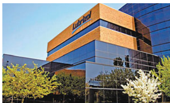
◀Lubrizol位於俄亥俄州的總部。