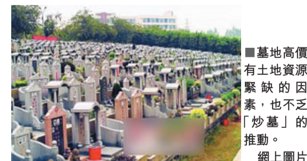
墓地高價有土地資源緊缺的因素，也不乏「炒墓」的推動。

記者了解到，一些靠近廣州市中心的墓園墓地價格普遍都達到了3萬元以上，以天河區的中華墓園為例，價格普遍在6萬—13萬元之間。而據「安居客」網發佈的最