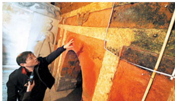
南京南唐二陵墓室瀕危彩畫修復保護工程完成第一階段，文物專家在欽陵墓室內向記者介紹彩畫修復效果，墓室一角(圖中右上角)保留着一塊作為對比的未修復壁面。

香港文匯報訊 據新華網報道，南京市文物局31日對外公佈，經過初步考證，此前在南京祖堂山南唐二陵附近發掘出的「第三陵」，墓主人為南唐宗室的一位貴婦，很可能是埋葬後主李煜的皇后大周后的懿陵。