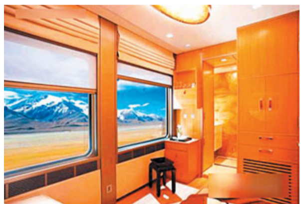
北京至拉薩豪華旅遊專列的內部模擬圖。

香港文匯報訊 據《西藏日報》報道，中央第五次西藏工作座談會提出做大做強做精特色旅遊業，把西藏建設成為重要的世界旅遊目的地。自治區旅遊局表示，今年全區旅遊無論是從加大宣傳、持續基礎設施建設、進一步拓寬進出藏通道以及加大鄉村旅遊扶持上都有新舉措。此外，北京—拉薩的豪華旅遊專列項目也在洽談中，預計今年開通。