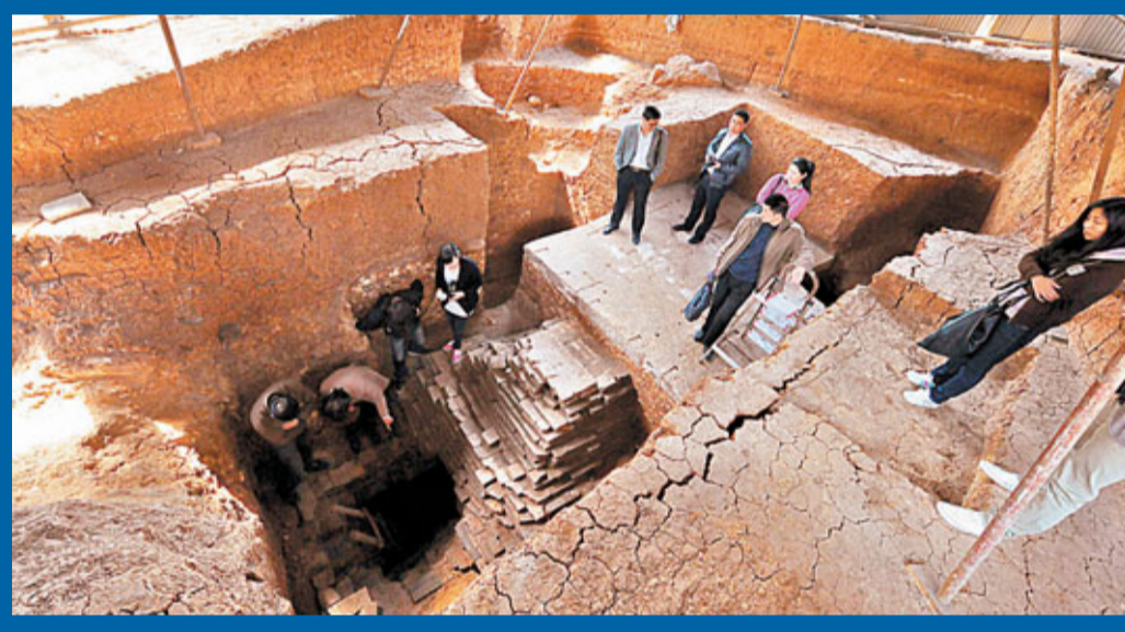
考古人員帶記者參觀南唐「第三陵」發掘考古現場。

此無法斷定墓主身份。但經初步考證，墓主很有可能是南唐後主李煜的皇后大周后。南京市博物館研究員王志高告訴記者，之所以有這樣的推斷，首先是由於該墓葬位於欽陵、順陵的延長線上，擁有同樣的形制，而從墓葬規模、耳室，以及墓室頂部所發現的多層厚重的石板等來看，墓主應該是一位南唐宗室的貴族。其次，隨墓葬出土的20餘件珍貴文物中多為女性頭飾。第三，墓室中的棺木雖已腐敗，但唯一存留的一根小腿骨經人類遺骸專家鑒定後認為是15至16歲左右的男孩，或者是成年