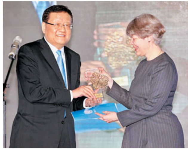
劉長樂向聯合國秘書長潘基文代表頒獎。