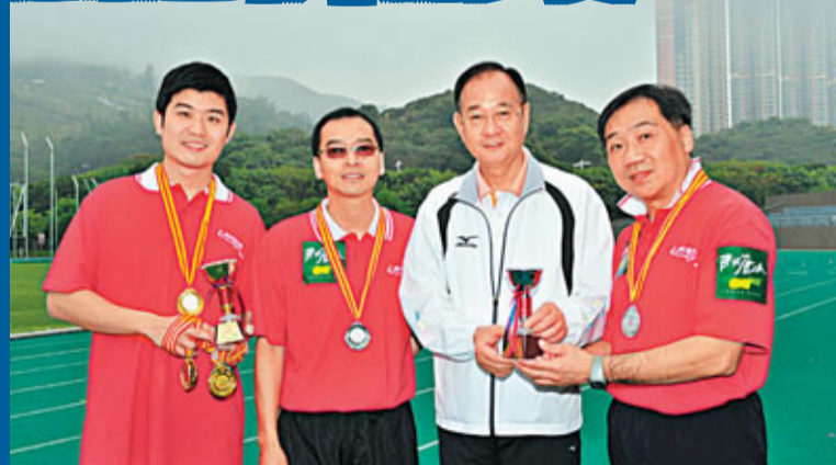
■港鐵公司及日出康城代表隊發揮團隊精神，勇奪「公開組」冠、亞軍。圖為西貢區議會主席吳仕福SBS太平紳士頒獎予得獎健兒。

「活出健康色彩」嘉許禮暨港鐵競步邀請賽2011，日前於將軍澳運動場舉行，旨在推動健康生活。競步比賽自2007年開始，每兩年一度，由港鐵公司與「西貢健康安全城市」聯合舉辦，今年已是第三屆。