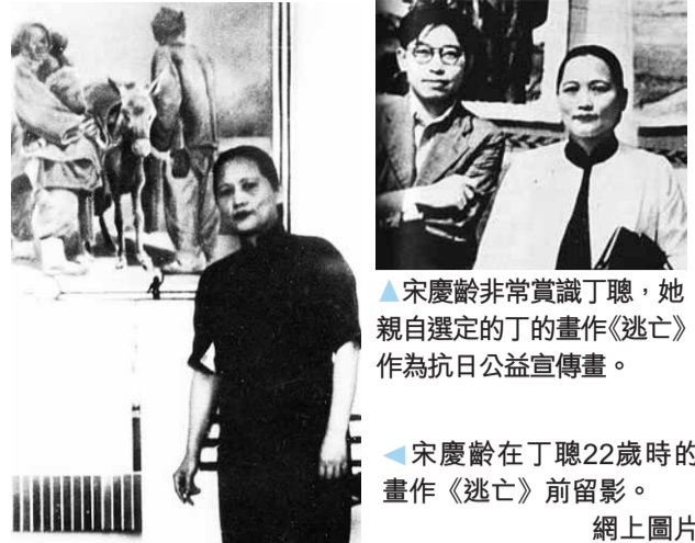
▲宋慶齡非常賞識丁聰，她親自選定的丁的畫作《逃亡》作為抗日公益宣傳畫。