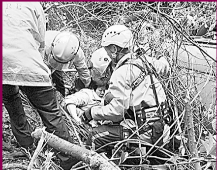
消防員救出被困客貨車女乘客。