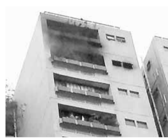
起火單位付之一炬，樓上單位外牆亦受波及熏黑。