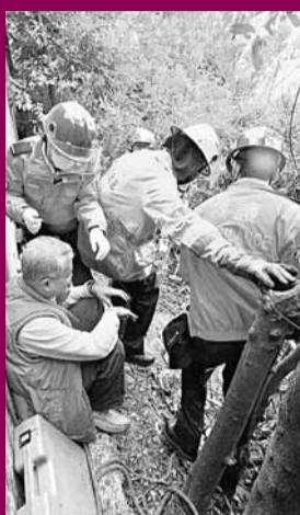
客貨車司機獲救後蹲坐地上等候送院。

在意外發生後，港島交通部一名警員，奉召駕電單車沿跑馬地黃泥涌道趕往現場調查，未料途經81號對開第3線時，突失控跌胎，當場車翻人仰，幸僅右手及右腳擦傷，送院敷治無大礙。而前日下午，新界南總區交通部一名警員，奉召駕駛電單車趕往處理交通事故，途經葵涌青山公路時亦失控翻車撞路欄，左手左腳骨折重傷。