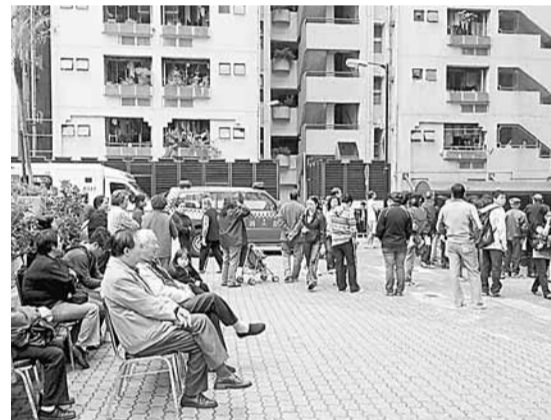
大批居民疏散到街上。