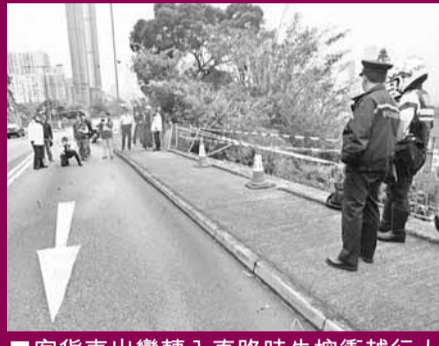
客貨車出彎轉入直路時失控衝越行人路墮坡。