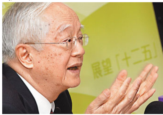
■吳敬璉教授出席港大「展望十二五」講座。

香港文匯報訊(記者 鄭治祖)全國人大早前通過的國家「十二五」規劃綱要對港澳地區設有獨立篇章，並支持香港將多個優勢產業作為未來發展定位。國務院發展研究中心研究員吳敬璉強調，香港與廣東在「十二五」期間實現經濟一體化，將是未來珠三角，乃至泛珠三角地區進行經濟發展轉型的關鍵。他明白，粵港合作需在「一國兩制」的原則下進行，但粵港地區可通過有變通性或根本性改革，打通珠三角和香港的更緊密聯繫，使香港發揮出帶動珠三角經濟轉型的強大力量，並謀求自身的進一步發展。