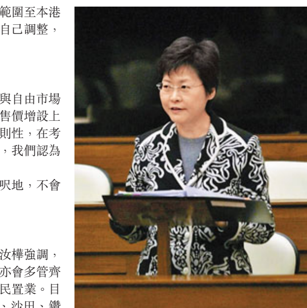
■林鄭月娥澄清政府推出限呎盤，並非協助市民上車。

陳家強在書面回覆時表示，特區政府通過26場諮詢會收到有關團體和人士的書面意見書共34份，而由去年11月29日財政司司長啓動公眾諮詢起至今年2月22日期間，透過郵遞、傳真、電郵及電話，共收到共3,400多份意見