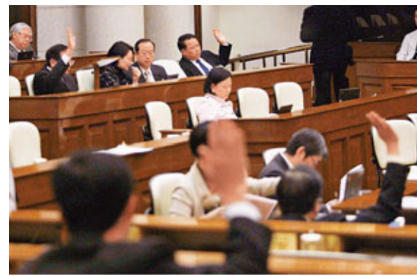
立法會昨日三讀通過食物安全條例草案。

食物及衛生局局長周一嶽在回應時表示，香港的日式食肆在核危機爆發後大部分已轉用其他地方的食材，包