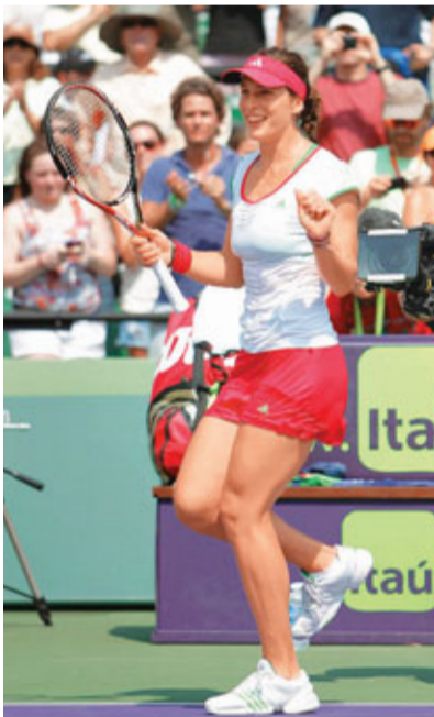
柏歌域賽後跳舞慶祝。