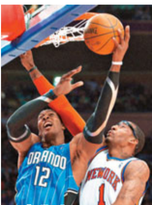
魔術中鋒杜韋侯活(左)上籃得分。

●有線165台及now678台7:00a.m.直播 ●now635台8:00a.m.直播 ●有線165台及now678台10:00a.m.直播 註：直播時間以電視台公布為準