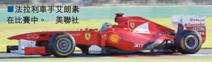
法拉利車手艾朗素在比賽中。