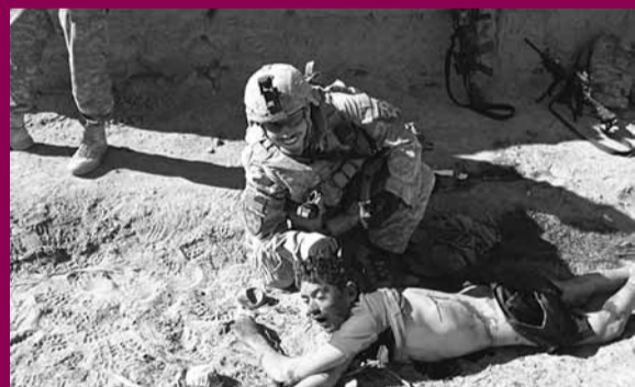
■拍照時還露出笑容，讓人髮指。