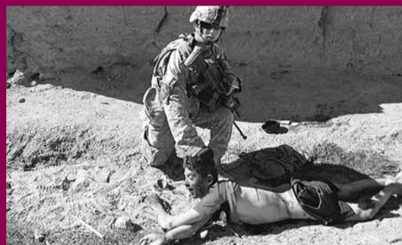
■莫羅克和同僚殺死少年後，將他脫光衣服，再抓起頭部拍照。