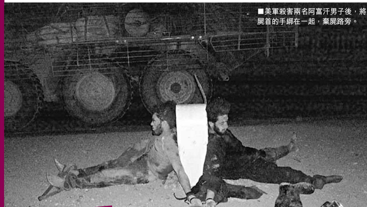
■美軍殺害兩名阿富汗男子後，將屍首的手綁在一起，棄屍路旁。