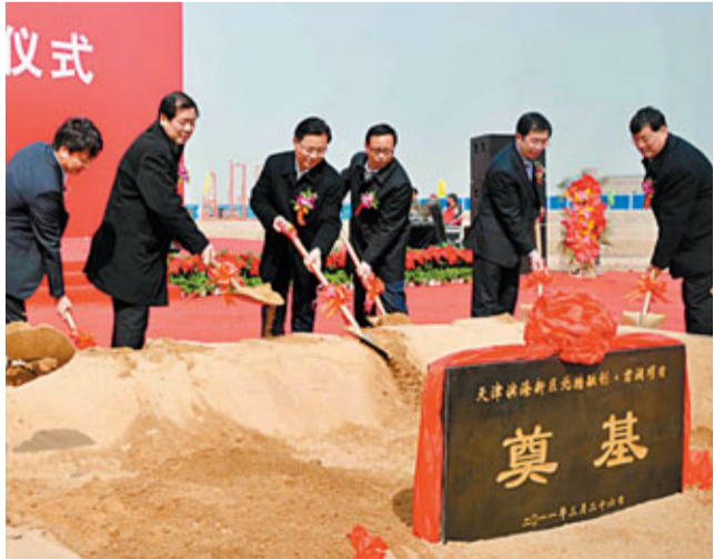
融創·君瀾項目開工奠基儀式，何立峰(左二)、宗國英(左三)出席。

據悉，融創·君瀾項目佔地12萬平方米，總建築面積約28萬平方米，產品包括高層、小高層和洋房，項目周邊有湖泊、河流、森林、濕地等優越的生態自然資源，同時五分鐘步行半徑之內還有商業、商務、酒店等服務中心。