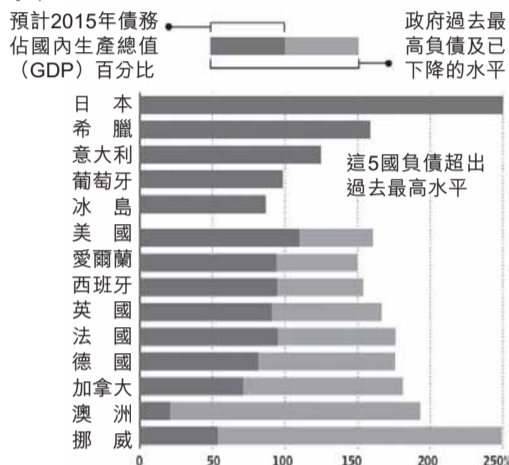
中央政府負債佔GDP百分比

發達國家的平均負債佔年經濟產出百分比，是自1948年以來最高水平。一些國家已接近或超越以往處理的債務水平。