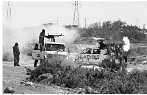
「革命軍」進攻蘇爾特時向政府軍開火。

北約前天宣布，將從美軍手中全面接管對利比亞軍事行動的指揮權。在西方聯軍空襲下，反對派昨日稱已攻陷「狂人」卡扎菲的家鄉蘇爾特，正朝西往首都的黎波里推進。消息稱，卡扎菲欲交權予兒子賽義夫，換取聯軍停火，賽義夫已與美、英和意大利的外交官提出停火條件，包括在2年過渡期後舉行大選，以及西方國家保證不清算卡扎菲家族。