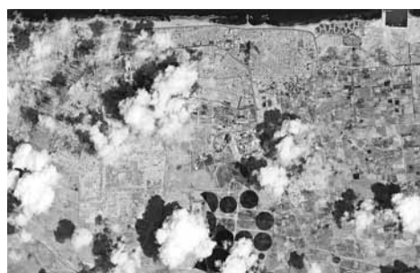
蘇爾特成為激烈戰場，衛星圖顯示該地區炮火密布。