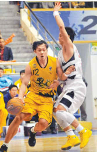
廣廈「野獸」林志傑(左)表現神勇。