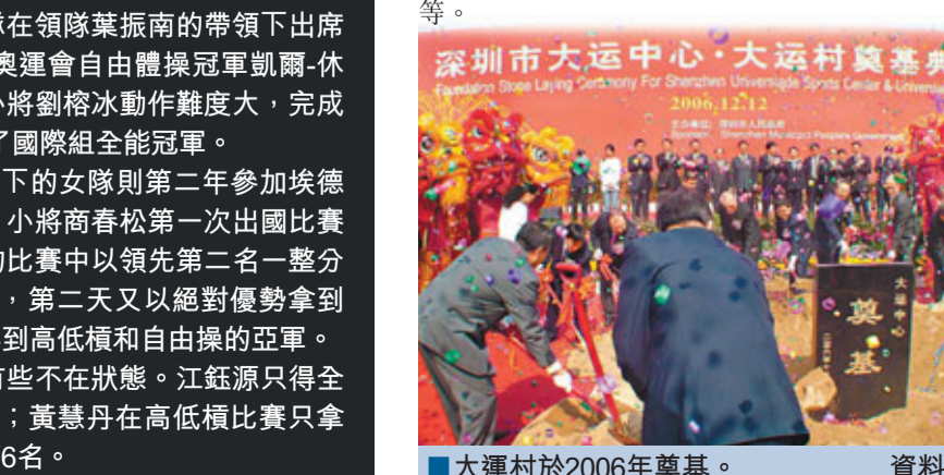
大運村於2006年奠基。資料圖片

此外,大運會志願者培訓也已開始進行,日前已有164名志願者參加首批志願者培訓。該批參加培訓的志願者是從賽會志願者隊伍中首次選取一批志願者提前服務於大運會的籌備工作,全部來自深圳各大高校。培訓的主要內容包括政策法規、城市和大運知識、志願者行為規範、語言培訓和應急培訓等。