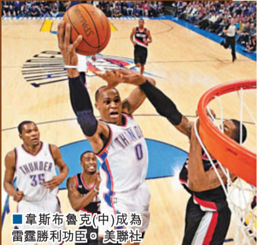
■韋斯布魯克(中)成為雷霆勝利功臣。

謝朗華萊士賽後說：「這(40分)是不足夠，我寧願獲勝多於拿下40分。」 同日另一場西岸賽事，湖人憑藉高比拜仁和加索爾分別獲得30分和23分，主場以18分之差大勝黃蜂，迎來7連勝，亦是自全明星賽後16場賽事勝出第15仗，目前戰績改寫為53勝20負，繼續向聯盟「一哥」馬刺(57勝16負)進迫。 ■蔡明亮