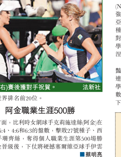
■阿金(右)賽後獲對手祝賀。

塞爾維亞男網球手祖高域勝停不了，周日在邁阿密公開賽第3圈，以直落2盤6:2和6:0大勝東道主老將比力克，強勢晉級，今年開季至今已20場全勝，直迫名宿蘭度在1986年保持的開季25場連勝紀錄。