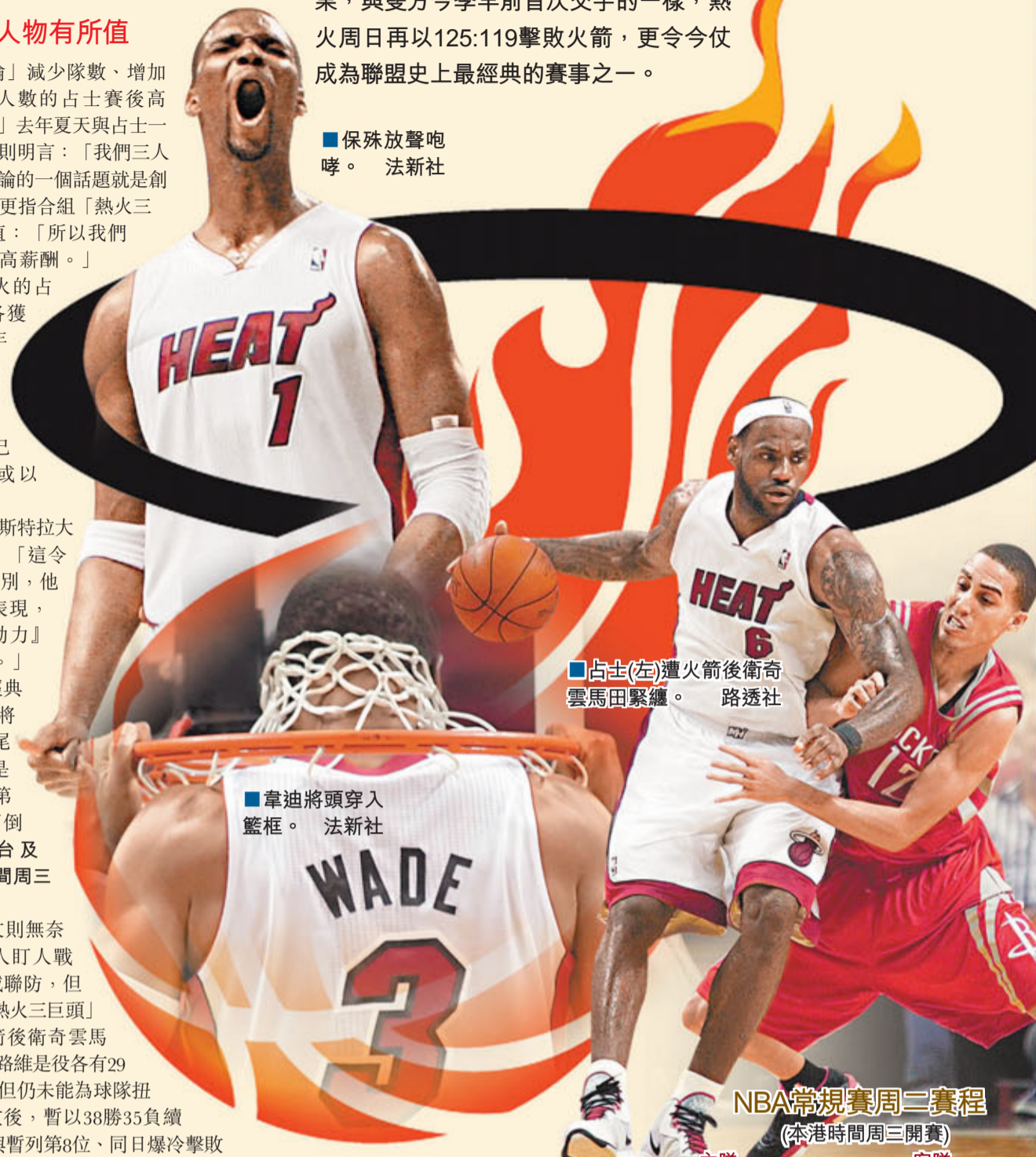
■占士(左)遭火箭後衛奇雲馬田緊纏。