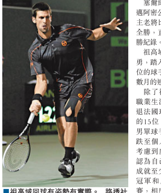
■祖高域回球有姿勢有實際。

塞爾維亞男網球手祖高域勝停不了，周日在邁阿密公開賽第3圈，以直落2盤6:2和6:0大勝東道主老將比力克，強勢晉級，今年開季至今已20場全勝，直迫名宿蘭度在1986年保持的開季25場連勝紀錄。