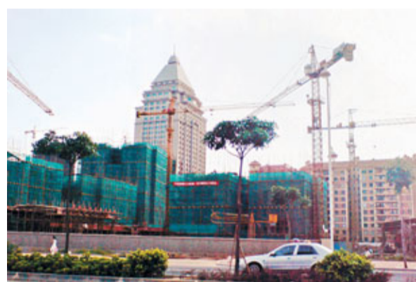
■廣東省只有佛山市公佈房價調控目標。

香港文匯報訊(記者 古寧 廣州報道)新「國八條」對各城市首季出房價調控目標的限期剩下不足一個星期時間。目前,僅有30多個城市發佈房價控制目標,京、滬、穗、深等一線城市均未發佈。在廣東方面,只有佛山公佈房價調控目標。業界人士預計,由於是硬指標,本周各城市將會密集出房價調控目標。