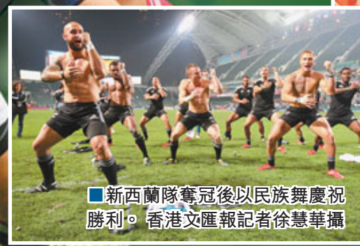
■新西蘭隊奪冠後以民族舞慶祝勝利。

另外，日本隊雖然於小組賽曾敗於美國手下，但於昨日銀碗賽擊敗蘇格蘭後，再於四強反勝美國晉級，不過決賽以12:33不敵技高一籌的加拿大屈居亞軍。日本賽後受到全場球迷熱烈祝賀，球員亦高舉寫上祝福日本字句的國旗繞場一周答謝香港球迷。銀碗方面則由南非奪得，銀盾由肯尼亞封王。