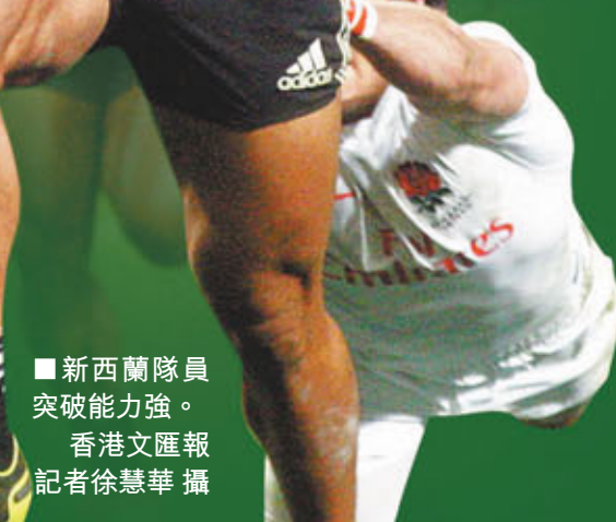
■新西蘭隊員突破能力強。

香港文匯報訊(記者 徐慧華)一連三日的「國泰航空/瑞信香港國際七人欖球賽」昨日完美落幕，雖然賽事曾一度受冷鋒及大雨影響，但無阻球迷將決賽日氣氛推至沸點，結果新西蘭在坐爆大球場的4萬球迷見證下，以29:17擊敗「宿敵」英格蘭，捧走代表賽事最高殊榮的銀盃，同時超越對手於世巡賽積分榜高居榜首。