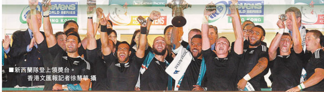
■新西蘭隊登上領獎台。