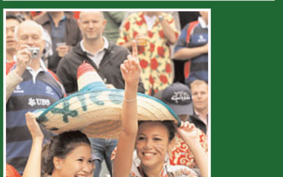
■新西蘭隊奪冠後以民族舞慶祝勝利。