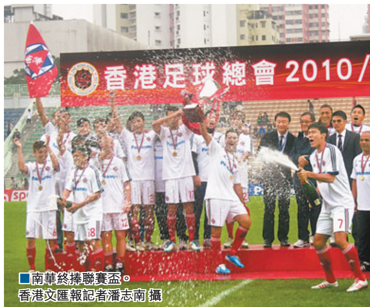
■南華終捧聯賽盃。

香港文匯報訊(記者 潘志南)天水圍飛馬門將又一次失位，造就畢特在第11分鐘先開紀錄，南華輕易以2:1勝出，第3度捧聯賽盃冠軍。入場球迷3,623人，場面熱鬧，票房收入165,160元，贏得的南華每名正選球員可獲15,000元獎金。