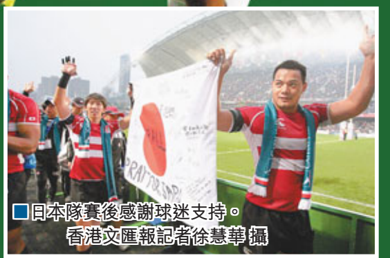
■日本隊賽後感謝球迷支持。