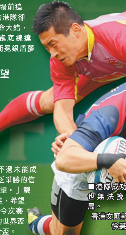
■港隊成功達陣也無法挽回敗局。

港隊銀盾8強出局下球員表現失望，教練戴里斯直言不滿球員表現：「我對今年賽果非常失望，我一度認為球員最少能殺入銀盾四強，不過未能成功，球員於場上的表現缺乏爭勝的信心，很遺憾令全場球迷失望。」戴里斯認為港隊心理素質欠佳，希望球員能盡快收拾心情，於今次賽事吸取教訓，全力於其後的世界盃外圍賽中，爭取首次殺入世盃。