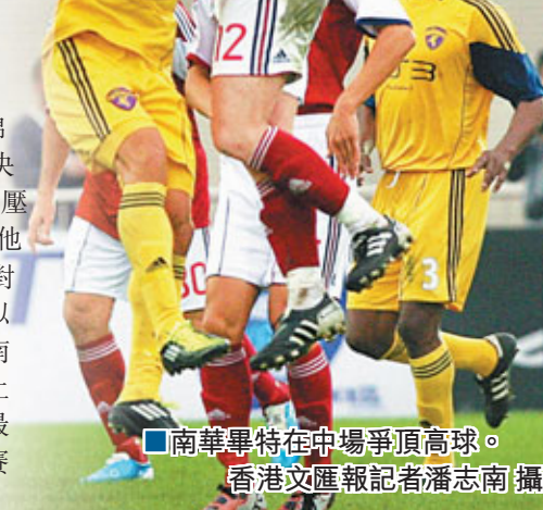
■南華畢特在中場爭頂高球。