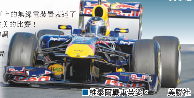
■維泰爾戰車英姿。