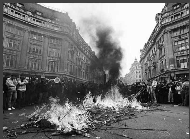
示威者在牛津街馬路中心縱火燒雜物。

英國倫敦昨日爆發50萬人大示威，抗議政府削減開支，期間數百名蒙面黑衣人離開大隊，破壞名店和銀行，與警員衝突，入夜後更進佔特拉法加廣場至昨日清晨，試圖將其變成開羅「解放廣場」。衝突造成84人受傷，包括16名警員，210多人被捕。傳媒形容和平示威「遭極端分子騎劫」，議員譴責暴力示威損害英國聲譽。