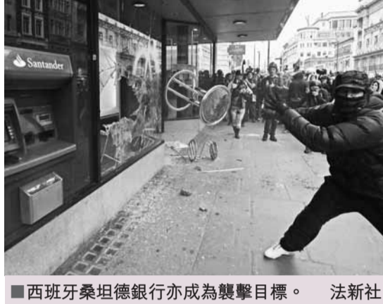
西班牙桑坦德銀行亦成為襲擊目標。