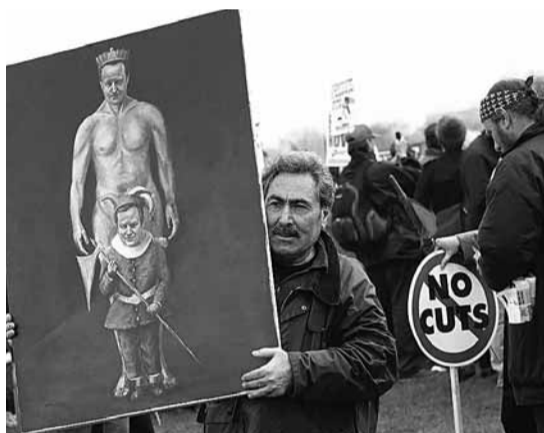
有藝術家拿來「國王的新衣」版正副首相卡梅倫及克萊格，諷刺二人。