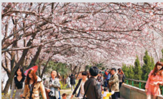
■遊人在武漢晴川閣的櫻花樹下欣賞、拍照。