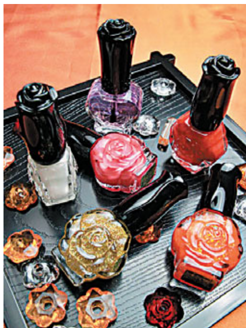
■ Anna Sui魔幻炫彩美甲油 HK$125