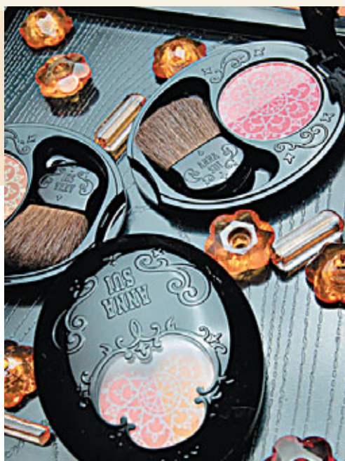
■ Anna Sui魔幻雙色胭脂 HK$210

在Sofina AUBE couture春日系列，全新彩形閃爍胭脂突破性加入嶄新設計——胭脂導向環，讓你簡易掌握最佳塗抹位置，塑造甜美可愛、白裡透紅的妝容。彩形閃爍胭脂，能配合任何膚色，顏色和光澤自然柔和，塑造健康膚色。只需輕輕撲上，就能塑造與膚色完美融合，充滿自然健康膚色。