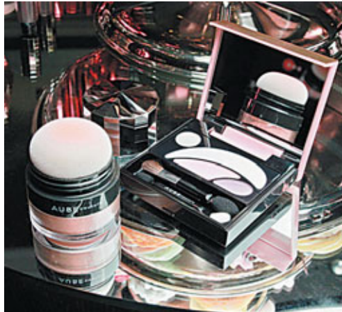
■ Sofina彩形閃爍胭脂（左）HK$230、彩形閃爍眼影組合（右）HK$240