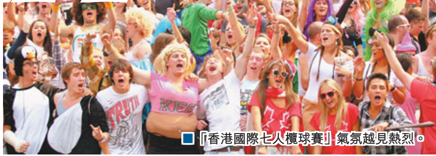
「香港國際七人欖球賽」氣氛越見熱烈。

繼首日熱身後，昨日一眾球迷一早已逼爆南看台，除扮鬼扮馬球迷的奇裝異服「升級」外，更有近4萬球迷坐爆大球場。被視為「扮嘢舞台」的南看台更於中午滿座，由於球迷一度於看台上大噴啤酒，大會曾一度封閉南看台及禁止攜帶啤酒，球迷需輪候3小時方可進入。