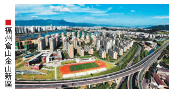
福州倉山金山新區

據悉,「十二五」期間,倉山將提升金山浦上、東部新城、白湖亭—三叉街三大商團,並借