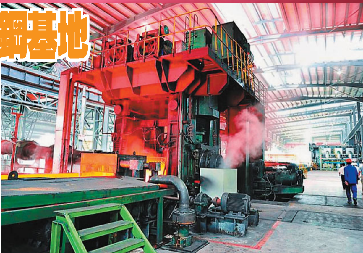
福建省政府與寶鋼集團簽訂戰略合作協議,寶鋼集團與德盛鍊業聯手,在福建打造全球最大不銹鋼生產基地。

據了解,目前寶鋼採用國際先進除塵工藝,關鍵部位煙氣排放達國家標準;生產用水全封閉循環,100%零排放;投資4000多萬元的脫硫設施已完工,二氧化硫排放也優於國家標準。今後,該企業將發揮寶鋼在資源集約利用、環境保護等方面的領先優勢,加大環保設施的投入規模和力度,實現鋼鐵產業與羅源灣生態環境和諧發展。