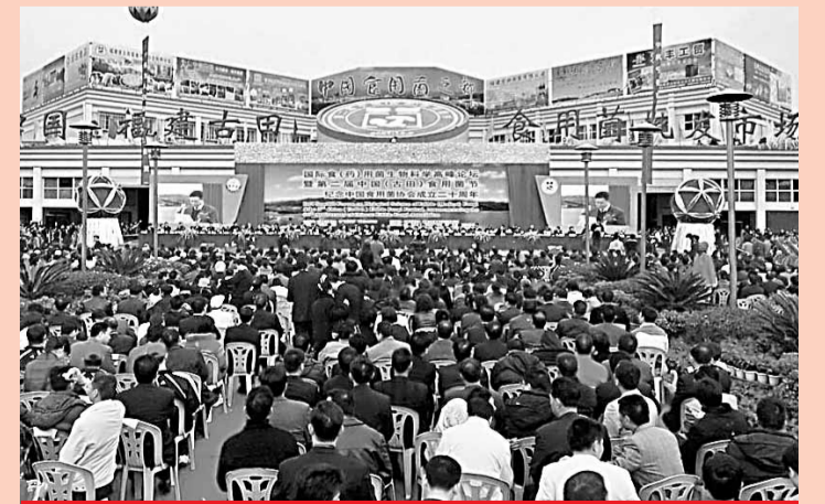
國際食用菌生物學高峰論壇在古田縣舉行

在古田縣,絕大部分的村莊都靠發展食用菌生產走上了致富路,實現了村強民富。全縣農村80%以上農戶從事食用菌產銷活動,直接從事食用菌產業人員達30多萬人,食用菌收入佔農民純收入的1/3以上。同時,古田縣還被聯合國定為國際食用菌人才培訓基地、聯合國「南南合作」示範基地協作網成員。世界各國和全國各地到古田學習食用菌生產技術的菇農及古田的種菇能手,技術員到全國各地傳授技術所培訓的農民超百萬人,所創造的直接產值超千億元。汶川地震發生後,古田縣派出的食用菌生