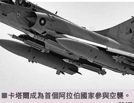
卡塔爾成為首個阿拉伯國家參與空襲。

利比亞政府發言人則表示，由於西方部隊狂轟濫炸，政府軍昨晨決定撤退，並指責聯軍直接支援反卡扎菲的叛軍。官員前天稱，在上周日至周三，最少有114人死於聯軍空襲，另有445人受傷，但沒說明當中有多少是平民。國家通訊