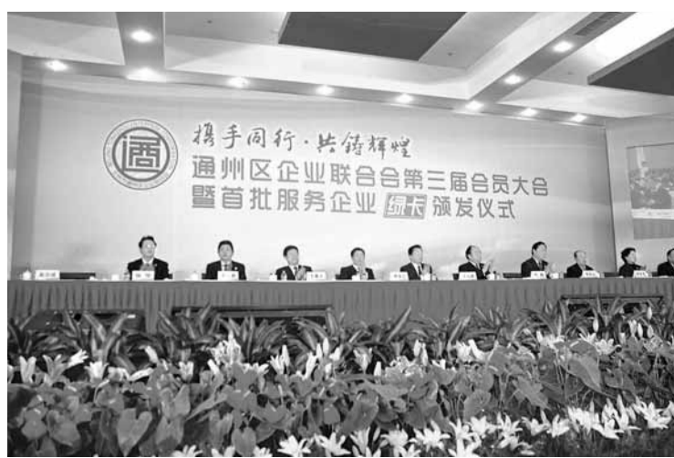
北京通州首批服務企業獲頒發「綠卡」的儀式現場。

各縣、區(市)重點建設1個產業聚集區。「十二五」末，全市產業聚集區主營業務總收入力爭達到6,000億元以上。