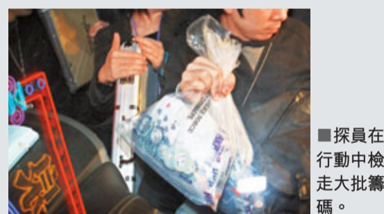
■探員在行動中檢走大批籌碼。

香港文匯報訊(記者 杜法祖)網上流行的德州撲克繼續由虛擬演變成真實非法賭局，警方根據線報，昨凌晨掃至尖沙咀一間樓上私人會所，搗破一個非法賭局，拘捕11名男女，檢獲2.5萬元籌碼。警方發言人提醒市民，德州撲克如牽涉金錢即為非法賭博，切勿以身試法。