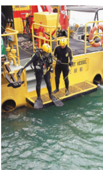
■消防蛙人昨繼續出動在尖沙咀天星碼頭海面搜索上周四墮海失蹤的女子。

香港文匯報訊(記者 杜法祖)消防蛙人昨晨繼續到尖沙咀天星碼頭，打撈3日前晚上墮海失蹤女子，消防派出潛水支援船及小艇在碼頭對開海面搜索，海事處船隻則協助封鎖航道，蛙人輪番落海沿天星碼頭至文化中心四個觀光船碼頭搜索，惟至入黑後結束仍未有發現。事發於3日前(24日)晚上9時許，有途人目睹一名女子墮海後失蹤，消防連日派員打撈，惜仍無結果。