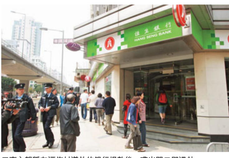
■事主報稱在福佬村道外的銀行提款後，甫出門口即遇劫。

有地產代理表示從不建議市民使用現金買樓落大訂，因動輒涉款數十萬甚至逾百萬元，更可能涉及「洗黑錢」條例，故普遍只會收支票或本票。銀行業人士亦提醒市民，到銀行提取大量現金，最好有其他親友陪同，並應盡量留意附近有可疑人物，如有懷疑切勿冒險離開銀行，可將款項重新存戶或致電親友到銀行接應才離去。