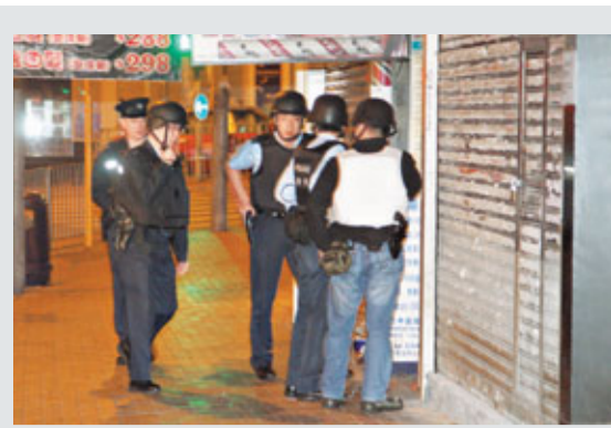
■觀塘物華街虛報有人開槍打劫，到場警員一度荷槍實彈戒備，場面緊張。