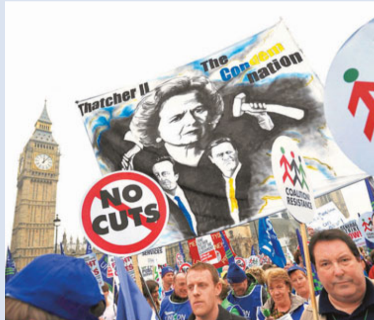
遊行隊伍行經國會大樓。

倫敦警察隊不敢怠慢，出動4,500名警員維持秩序，並警告可能使用「圍堵」(kettling)手段控制群眾。副警長歐文斯表示，會毫不猶豫地對付犯罪及暴力行為，使用「圍堵」是最後的手段。面對民眾反對聲浪，英國副首相克萊格指上任工黨政府造成政府