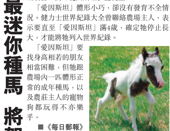
「愛因斯坦」與另一匹成年種馬老友鬼鬼。

去年4月，美國新罕布爾州巴恩斯特德一個農場外人龍不絕，搶着看剛出生、只有50厘米高的「愛因斯坦」(見圖)。這匹全球最迷你種馬如今快將度1歲生辰，農場主人正籌備推出新書，為「愛因斯坦」慶祝生日。