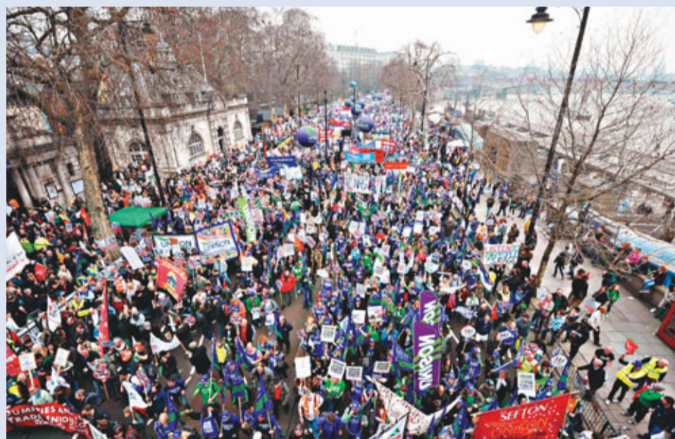
今次倫敦示威的規模，是03年反伊拉克戰爭示威以來最大。

英國政府實施緊縮政策，大削公共開支，激起民憤，大批示威者昨日在倫敦示威，工會稱示威者多達40萬人，是2003年反伊拉克戰爭示威以來最大規模，當局動員4,500警力控制秩序。執政聯盟指責是上任工黨政府造成英國財政陷困，又要求示威者提出辦法紓緩財赤。