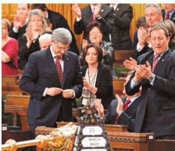
哈珀(左)出席國會的不信任動議投票。