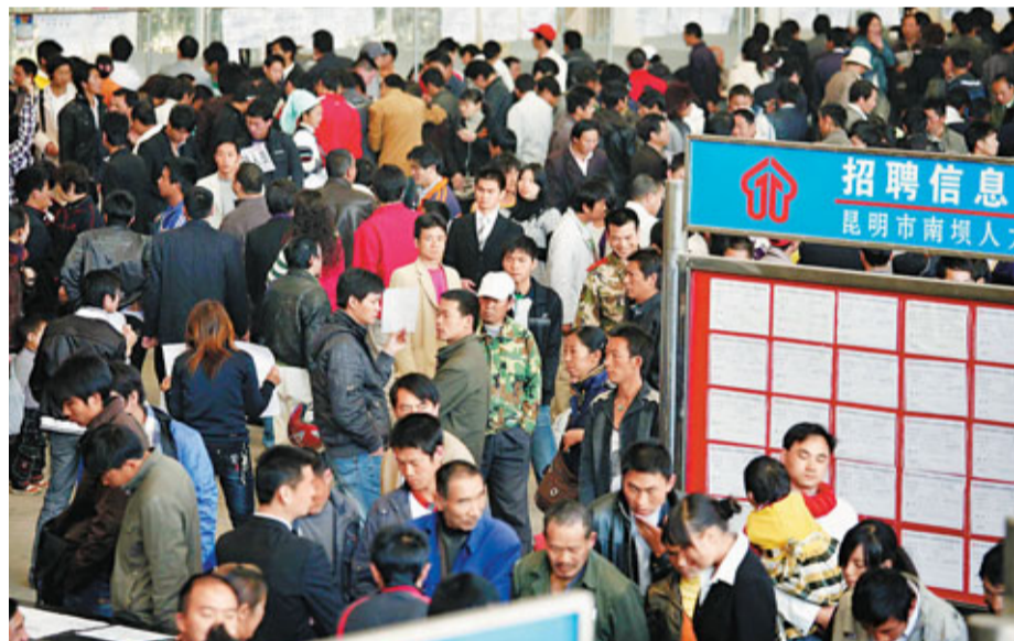
農民工的薪水達到了前所未有的程度,但依然存在很嚴重的用工荒,說明工資還會繼續上升。

香港文匯報訊(記者 周逸 上海報道)中央農村工作領導小組副組長、中農辦主任陳錫文(右小圖)26日出席「十二五」城鎮化發展高層論壇時表示,中國過去城鎮化發展的「三低」動力已經消失,未來五年的城鎮化發展任務相當艱巨,在推進過