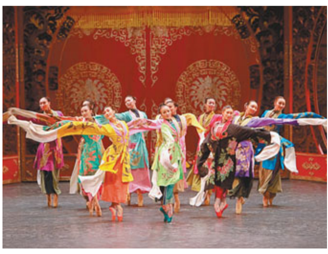
中央芭蕾舞團保留劇目《大紅燈籠高高掛》。

2001年5月2日,《大紅燈籠高高掛》在北京天橋劇院正式拉開巡演序幕,一經推出,在中國乃至世界舞蹈界都引起了不小的震動。十年來,《大紅燈籠高高掛》已經演出了近400場,中央芭蕾舞團攜該劇走過了世界各地幾十個城市,所到之處受到的歡迎幾乎是一致的空前,各國的媒體也都給予了相當高的評價,把這部舞劇稱為是繼《紅色娘子軍》之後,在21世紀代表中國芭蕾舞最高水準的作品之一。中央芭蕾舞團還因該劇與莫斯科大劇院芭蕾舞團、美國紐約城市芭蕾舞團等世界頂級芭蕾舞團並列獲得有舞蹈奧斯卡之稱的英國「國家舞蹈大獎」最佳外國舞蹈團提名,確立了中芭世界名團的地位。