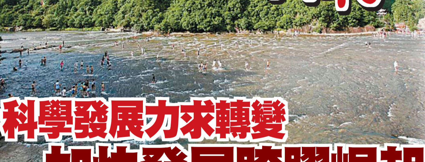
■白水洋世界地質公園水上廣場