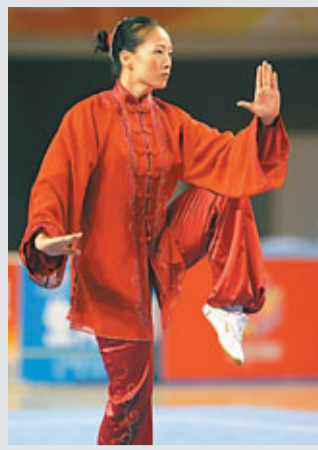
■中國武術將訂10套標準。圖為太極拳。

據中新社太原26日電 中國武術協會主席高小軍表示，2011年是中國武術的標準化年，將建設10套標準化體系，推動武術運動規範化發展。