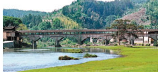
■中國木拱廊橋傳統營造技藝列入聯合國教科文組織「急需保護的非物質文化遺產名錄」，圖為全國現存最長的古代木拱廊橋——萬安橋。