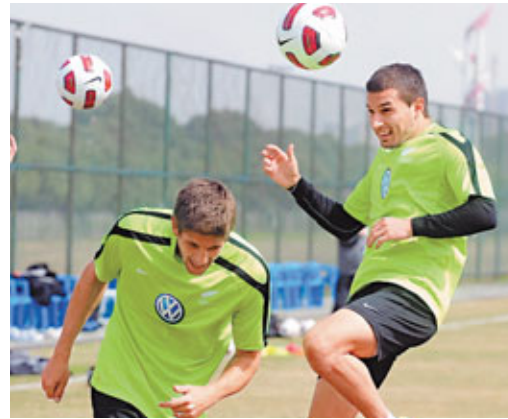
■新西蘭球員苦練頂上功夫。

雖新西蘭此次來華的僅有17人，正好滿足了正選11人，更換6人的基本要求；但斯梅爾茨和基倫這對新西蘭鋒線組合的衝擊力，再加上球隊一向善於大腳長傳急攻的「空襲式」進攻打法，相信絕對有能力考驗由「威鋒組合」領導的國足後防線。