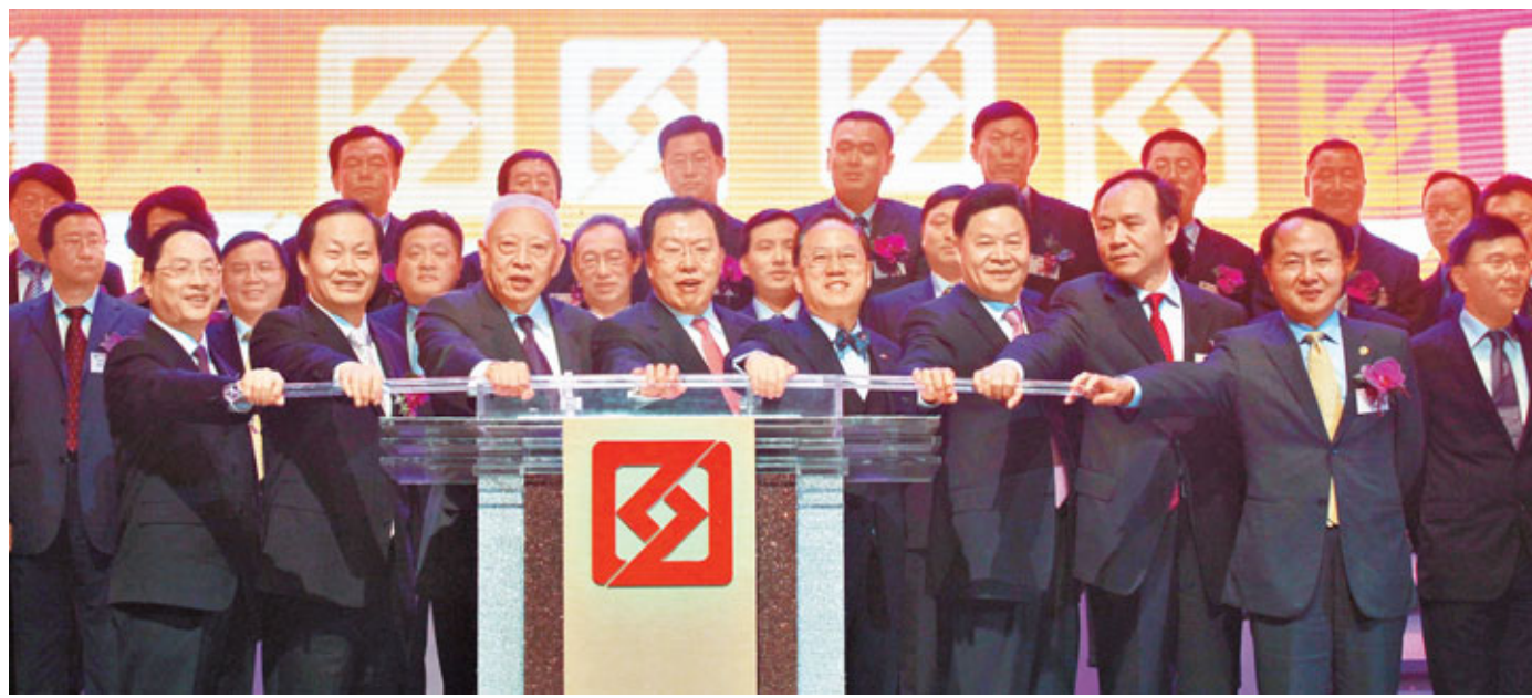
董建華、曾蔭權、彭清華、張學武等主持亮燈。

香港文匯報訊(記者 沈清麗) 香港中國企業協會昨晚假灣仔會展大會堂隆重舉行慶祝成立20周年慶典晚會。晚會冠蓋如雲，全國政協副主席董建華、香港特區行政長官曾蔭權、中聯辦主任彭清華、外交部駐港特派員呂新華、商務部副部長蔣耀平、國務院港澳辦副主任周波、中聯辦副主任王志民、澳門中聯辦副主任高燕等一眾政要出席主禮，聯同會長張學武主持亮燈和祝酒儀式，逾1,200人舉杯同賀，氣氛熱烈。