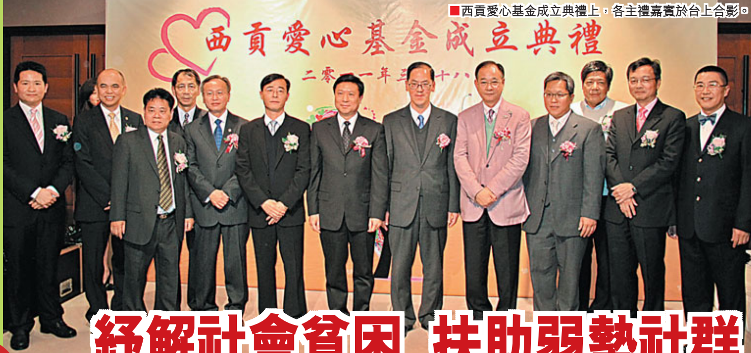
西貢愛心基金成立典禮上，各主禮嘉賓於台上合影。