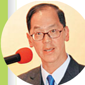
香港特別行政區民政事務局長曾德成致辭