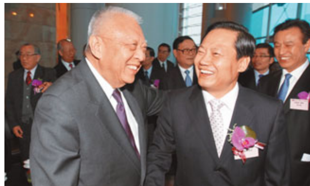
彭清華(右)與董建華開心交談。

張學武亦指出，中企協會20年來廣泛聯繫各界朋友，支持特區政府依法施政，推動兩地經貿交流合作，廣泛開展與香港和境外工商團體的交流合作，同時積極為會員服務，組織會員參加社會公益活動等。