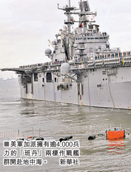
■美軍加派擁有逾4,000兵力的「班丹」兩棲作戰艦群開赴地中海。

1976年離國，在華盛頓大學任教經濟及金融，上月利比亞現示威騷亂後才返國。政府軍和反對派在多個城鎮的拉鋸戰持續，在米蘇拉塔，政府軍坦克在聯軍空襲下一度撤出，其後捲土重來，再發動攻擊。當地一名醫生指親卡扎菲的狙擊手已殺死17人；反對派發言人稱，政府軍甚至向米蘇拉塔唯一一家醫院開火。美軍前日向利比亞增兵，從弗吉尼亞州的母港加派擁有逾4,000兵力的「班丹」兩棲作戰艦群開赴地中海。「班丹」作戰艦群由兩艘攻擊艦「班丹號」領頭，包括兩艘船塢運輸艦「弗德台」號及船塢登陸艦「惠德比島」號，作戰兵力主要来自美國海軍陸戰隊第22遠征隊。