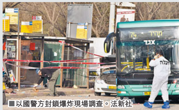
以色列聖城耶路撒冷昨日發生6年來首宗炸彈襲擊，導致1名59歲女子死亡、逾30人受傷。以色列指襲擊是巴勒斯坦武裝分子所為，總理內塔尼亞胡誓言採取「嚴厲、負責且明智的回應」。以色列戰機隨即於昨日凌晨轟炸加沙地帶多處目標，控制當地的哈馬斯組織宣布加沙地帶進入緊急狀態。

炸彈襲擊於前日下午約3時30分發生，當時一輛巴士在市中心巴士站和國際會議中心之間準備載客時，一枚炸彈突然爆炸，巨大的爆炸聲響徹整個耶路撒冷城，有人躺在地上流血，數百米外的房屋也感受震動，許多車輛的玻璃窗被震碎。