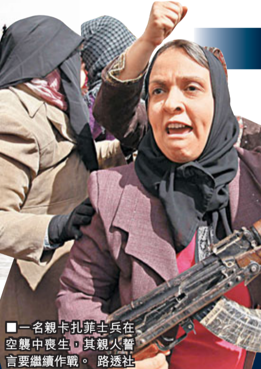
■一名親卡扎菲士兵在空襲中喪生，其親人誓言要繼續作戰。