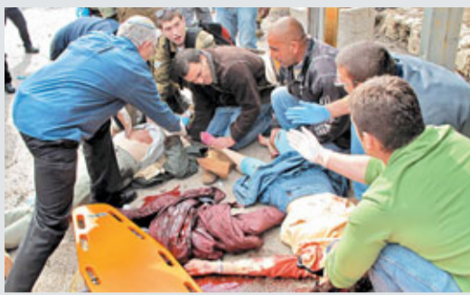
■救援人員搶救事件中的傷者。