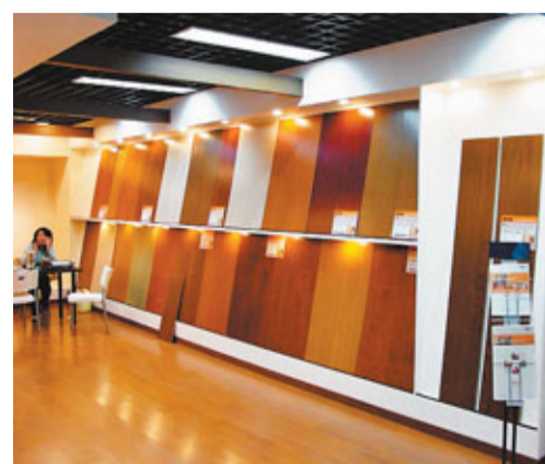
■美國商務部初步裁定對中國木地板徵收27.01%的反補貼稅。

美國製造商同時要求對中國木地板徵收高達281%的反傾銷稅,但美商務部最早要到今年5月才能就此作出裁定。