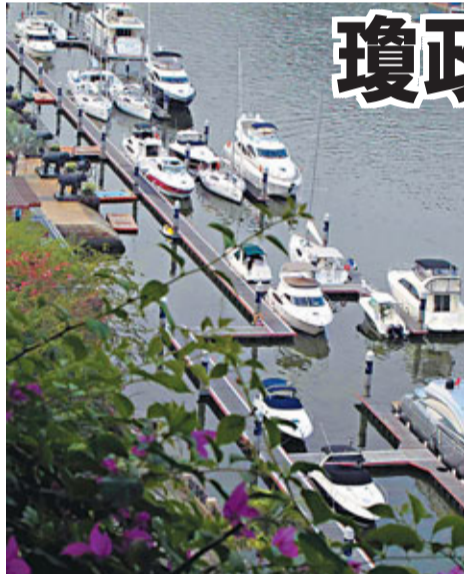
■海南島以陽光與海灘聞名,乘遊艇出度假尤其受歡迎。圖為三亞遊艇碼頭。

香港文匯報訊(記者 何玫,實習記者 陳玉婷)針對海南「離島免稅」政策會否對香港「購物天堂」形成競爭,海南官員、學者和業界均表示,該項新政不會對香港旅遊購物構成威脅,希望瓊港加強合作,共同發展。