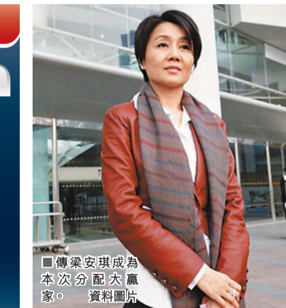
傳梁安琪成為本次分配大贏家。 資料圖片