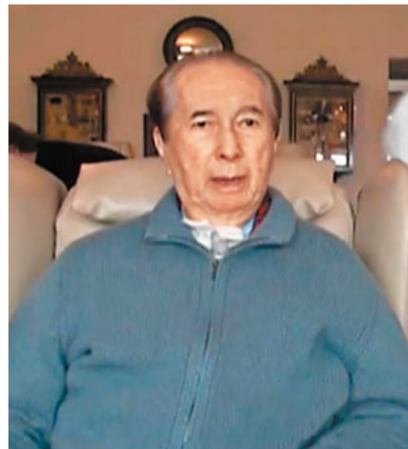
何鴻燊分身家事件，搞得滿城風雨，最終家和萬事興，大團圓落幕。