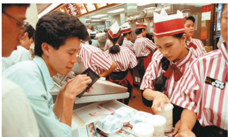
中國首家麥當勞餐廳於1990年在深圳開業。 資料圖片