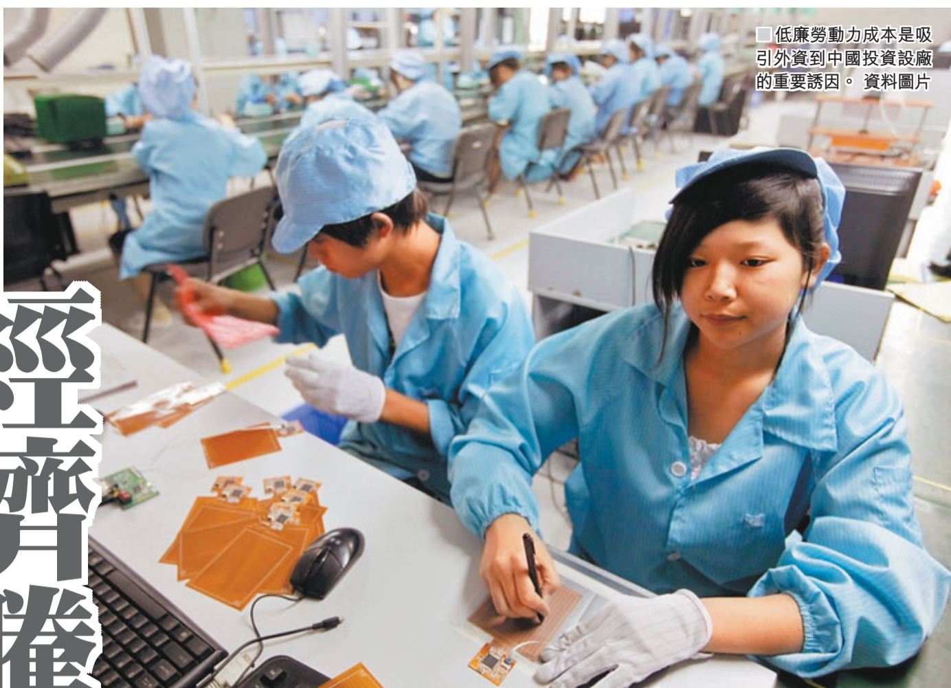
低廉勞動力成本是吸引外資到中國投資設廠的重要誘因。 資料圖片