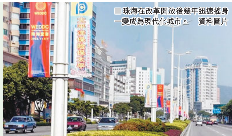
珠海在改革開放後幾年迅速搖身一變成為現代化城市。 資料圖片