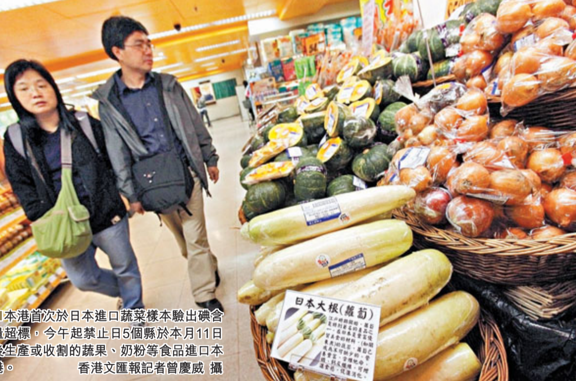
本港首次於日本進口蔬菜樣本驗出碘含量超標。今日起禁止日5個縣於本月11日後生產或收割的蔬果、奶粉等食品進口本港。