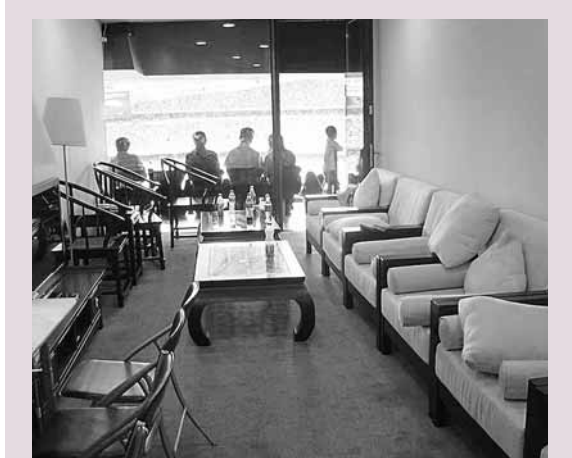
鳥巢包廂。網上圖片