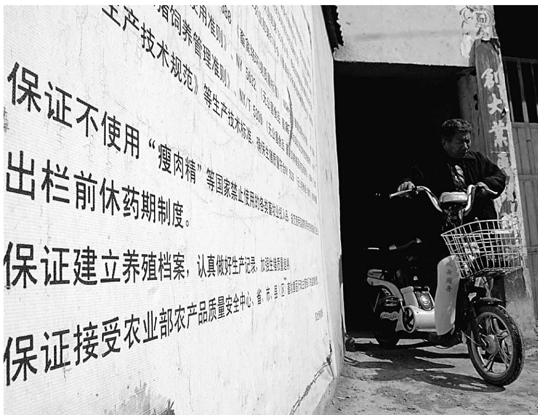
河南一家養豬場大門口張貼着有關養殖規則。近日河南展開大規模瘦肉精監測。

另據了解，商務部新聞發言人姚堅22日表示，從去年開始，商務部在全國的10個城市啟動豬肉和蔬菜的質量追溯系統，在這次應對「健美豬」事件中發揮了重要作用，在河南和南京迅速找到了發源地。商務部今年將新增10個城市，進一步開展豬肉和蔬菜質量追溯體系，嚴控食材質量。