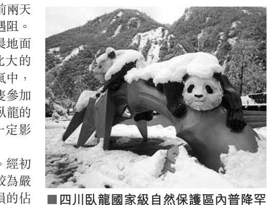
四川臥龍國家級自然保護區內普降罕見暴雪。

大雪致使區內很多林木被壓彎、倒伏甚至斷裂。經初步統計，1,228.5畝「退耕還竹工程」的竹子受損較為嚴重，其中受損竹子中被壓倒伏的佔80%，折斷破損的佔20%左右，估計受損竹子總數達24萬多株。