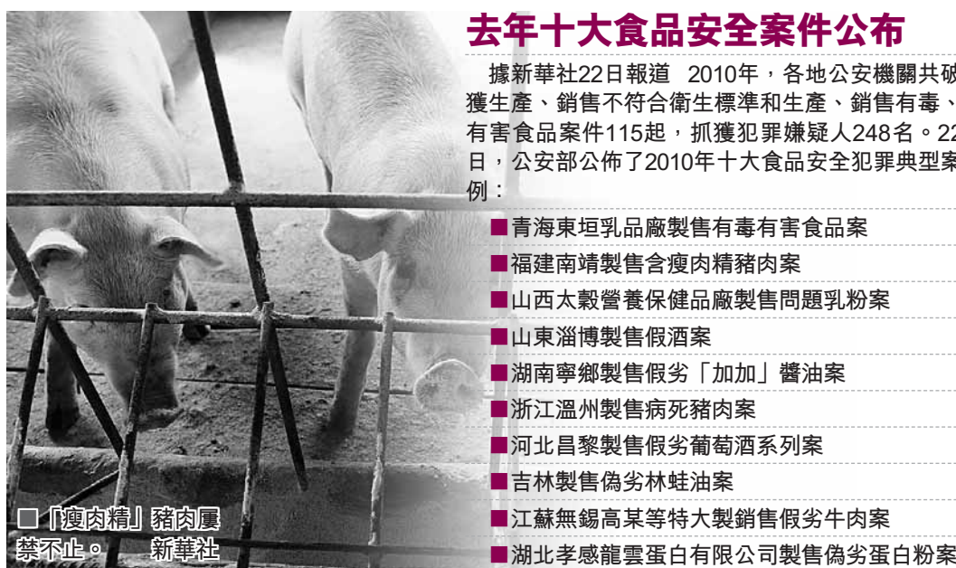
「瘦肉精」豬肉屬禁品。