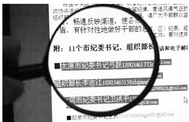
在山西省的部分政府網站和主要新聞網站都可以查詢到紀委書記和組織部長的電話。新華社

據新華社22日電，山西省紀委、山西省委組織部兩部門聯合公佈的260名各市、縣(市、區)紀委書記、組織部長的電話號碼，竟然有145個打不通！這條消息近日在網絡上引發網民關注和爭議，有網民毫不客氣地指「這是作秀！」對此，山西省委組織部負責人表示，公佈官員電話起震懾作用，相關實施方法還在研究之中。