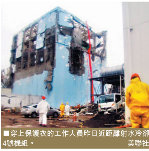
■ 穿上保護衣的工作人員昨日近距離射水冷卻4號機組。