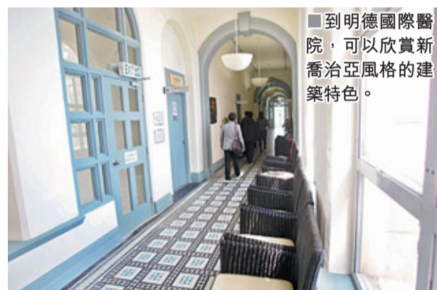
到明德國際醫院，可以欣賞新喬治亞風格的建築特色。