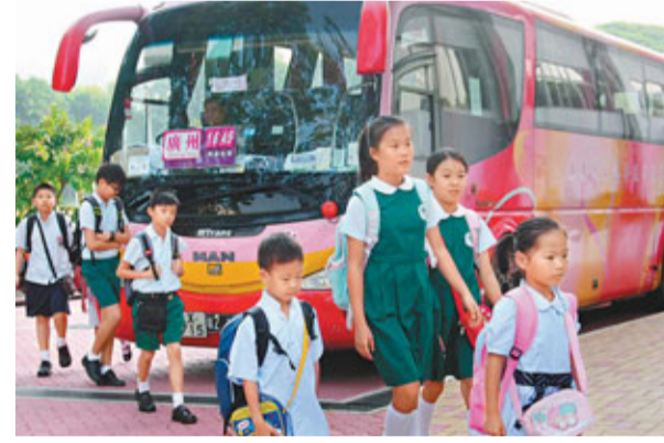
■為支援跨境學童往返兩地上下課，今學年香港與廣東協定，發出65個跨境校巴特別配額及30個額外北行班次，逾1,900名學童將受惠。圖為學童跨境上學情況。資料圖片

香港文匯報訊(記者 任智聰) 隨着香港與內地交流增多，居於內地而入讀本港中小學的跨境學生人數節節上升。香港教育局提交立法會財務委員會資料顯示，過去5年，跨境中小學生由3,677人增至6,113人，急升66.2%，其中中學生更大升逾9成。為支援跨境學童往返兩地上下課，今學年香港與廣東經協定，發出65個跨境校巴特別配額及30個額外北行班次，逾1,900名學童受惠。