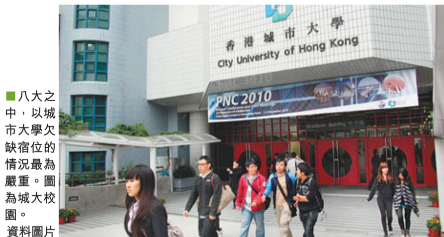
■八大之中，以城市大學欠宿位的情況最為嚴重。圖為城大校園。資料圖片

教育局指，由於政府核准本科及研究生課程學生人數有所增加，加上非本地生上限增至20%，令公帑資助學