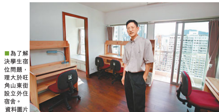
■為了解決學生宿位問題，理大於旺角山東街設立外住宿舍。

香港文匯報訊(記者 任智聰) 香港致力發展成為區域教育樞紐，故積極將各大學錄取非本地生上限增至20%，不過，此舉卻令學生宿位短缺更見嚴重。教育局提交立法會財委會資料顯示，今學年8大院校現有或興建中宿位約2.8萬個，若以20%非本地生上限推算，宿位短缺多達8,229個，當中城市大學欠逾2,100個，最為嚴重。