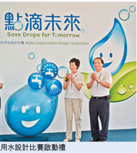
節約用水設計比賽啟動禮

水務署一直致力研究世界其他先進地區已進行試驗的供水技術，並在本港環境進行測試，以監察我們的供水輸送系統的情況、檢測水管滲漏及調控水壓，從而建立一個更有效率及更具成本效益的運作模式。相信新技術配合其他措施如「更換及修復水管計劃」等工作，本港整體水管滲漏率及爆裂率將會持續下降。