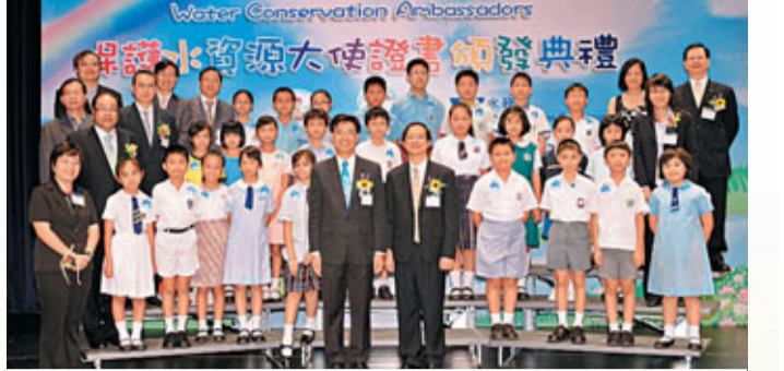
水務署去年選出450多位保護水資源大使

水務署自2009年推出「節約用水，從家開始」活動以來，無論是派員到小學向學生推廣善用食水的訊息，或舉辦的「保護水資源大使選拔賽」，都廣獲師生的支持及參與。2010/11學年的活動已展開，現時已獲選到100間小學進行講座；另有超過40間小學報名參加新一屆的「保護水資源大使選拔賽」。為了方便學校靈活地與學生分享節約用水的訊息，水務署繼去年的「節約用水，從家開始」教學資料套後，現正製作一份「校園用水考察活動」的資料套，準備下學年派送到全港所有小學。水務署去年9月舉辦了「節約用水設計比賽」，徵集大專學生、物業管理界及飲食業三大界別具創意的節約用水設計及實用節水措施。比賽結果將於4月公佈；得獎作品將於4月下旬開始在全港多個地點巡迴展出。除了平日在電視常見的30秒宣傳廣告，水務署現正製作一齣15分鐘的短片，以故事形式提醒大眾日常生活中種種節約用水的可能。