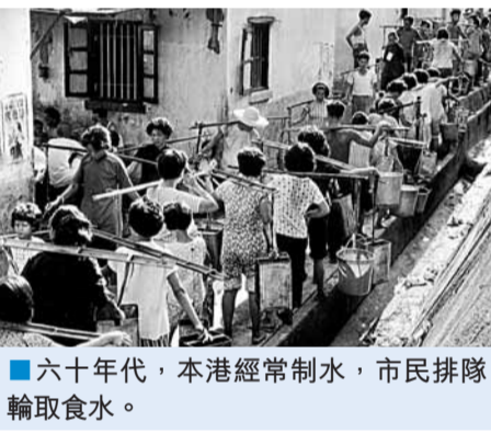
六十年代，本港經常制水，市民排隊輪取食水。

香港供水歷史始於1851年，當時政府動用公帑在市區挖掘了幾口水井，自此政府便肩負起供水的重任。如何在這片水資源極度貧乏的土地上，開發充足的水源以滿足急劇增長的人口所需，成為歷任政府的首要任務。20世紀中葉開始，為了應付戰後人口及經濟增長帶來的用水需求，政府不斷興建水庫蓄水，集水計劃愈見龐大；然而，水資源開發始終未能跟上用水需求，以致限制供水（俗稱「制水」）成為戰後初期的例行公事。政府於是大量投入資源，在20多年間相繼完成四項極為龐大及創新的水庫工程，在得到各方大力協助下，香港於1960年開始從廣東省輸入淡水，並於1965年3月透過東深供水系統增加輸入東江水，令本地逐漸解除水荒的威脅。此外，香港亦積極開發以海水沖廁的