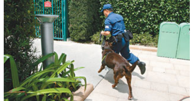
迪士尼樂園保安員日常會帶同狗隻在樂園範圍巡邏。

香港文匯報訊（記者 蔣焯文）大嶼山竹篙灣港迪士尼站對開幻想道公共交通匯處，昨晨9時許發生可疑物體驚魂，迪士尼樂園一名保安員，攜同一頭拉布拉多犬巡邏期間，犬隻對垃圾桶內3個載有液體可疑膠樽有異常反應，樂園方面為安全計報警，警方到場調查後，證實3個膠樽內盛載的僅是普通液體，事件僅虛驚一場，列作警調處理，期間港鐵列車及樂園服務不受影響。