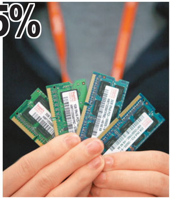
■專家表示，日本短時間內最可能做的是把半導體生產轉移到關西地區。資料圖片

至於日本地震對中國資本市場其他方面的影響，專家認為，短期來看，夏天將至，日本一定會通過火力發電來緩解供應的不足，對天然氣和石油的需求會大幅度上升。長期來看，中國社會科學院經濟研究所研究員袁綱明認為，日本會停止在未來發展核電。不過，2011年諾貝爾經濟學獎得主斯蒂格利茨表示，發展核電是安全的，將來還要大力發展核電，與此同時，石油、天然氣價格將隨各國釋放儲備而下降。