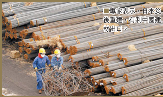
■專家表示，日本災後重建，有利中國建材出口。

英國《金融時報》21日發表文章指出，日本重建可能為中國經濟帶來向上的動力。文章稱，日本重建將帶來對基礎設備和原材料的大量需求，對於日本最大的貿易夥伴中國來說，這也意味着日本的經濟刺激將為中國帶來相關的需求增長。同時，中國大量存在產能過剩的行業，尤其是鋼鐵行業，將從中受益。薛求知則告訴記者，日本震後經濟的重建，會為中國企業提供出口鋼