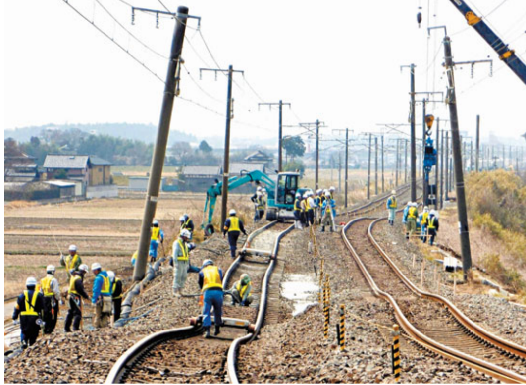
日本地震發生超過10日，重建工作逐步開展，圖為工人在茨城縣維修路軌。

基礎設施損失最少7658億圓 日本國土交通省昨日表示，大地震後，單計東日本和靜岡縣，地震造成有6,400處的道路、公共基礎設施損毀，經濟損失達7,658億日圓(約735億港元)。但上述金額，並未包括重災區岩手縣和政府直轄項目的損失。 據悉，這次調查的公共基礎設施，未包括機場、鐵路、學校及農田等。政府直接及地方政府的項目損失額，亦未清楚。日本政府表示，國家將負擔重災區地方政府80%至90%的重建費。