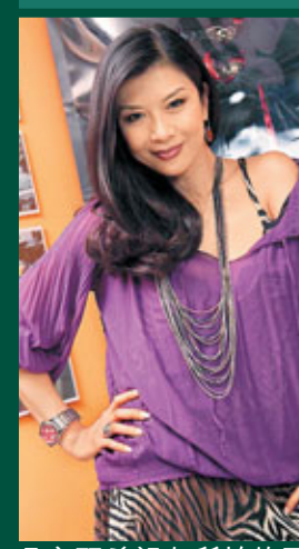
吳家麗希望在所拍的電影中能有所發揮。

吳家麗在1993年憑《郎心如鐵》榮膺金馬影后，問到會否想憑新片再問鼎影后寶座？她表示獎已經拿過，機會還是留給別人。而且獎項的事不需要太刻意，當年自己也沒想過能拿金馬影后。