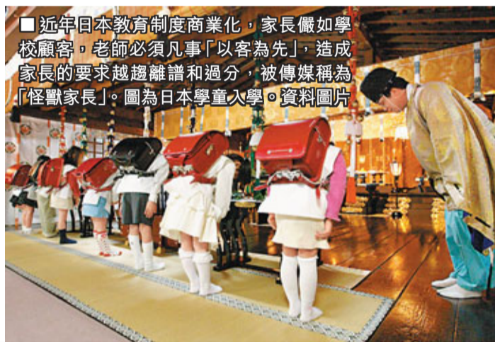
近年日本教育制度商業化，家長儼如學校顧客，老師必須凡事「以客為先」，造成家長的要求越趨離譜和過分，被傳媒稱為「怪獸家長」。圖為日本學生入學。資料圖片

香港的出生率近年持續下降，很多本地家庭奉行「一個起、兩個止」的生育原則，子女變得珍貴。他們不但自我中心，而且缺乏解決問題的能力，需要別人保護。