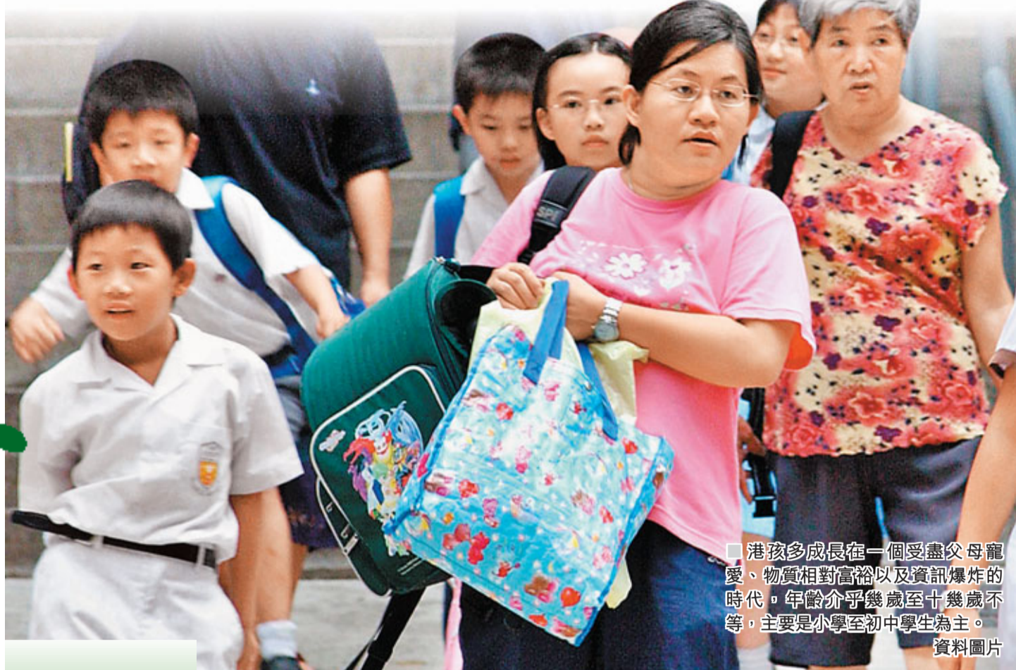
港孩多成長在一個受盡父母寵愛、物質相對富裕以及資訊爆炸的時代。年齡介乎幾歲至十幾歲不等，主要是小學至初中學生為主。 資料圖片