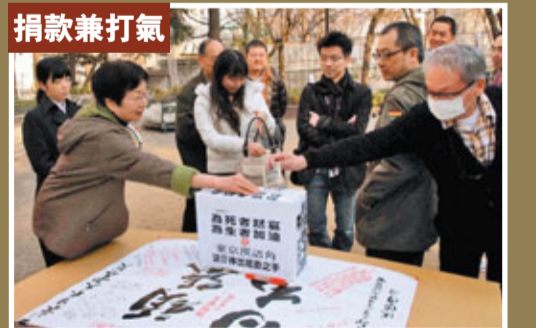
20日，由日本僑報社和日本湖南人會聯合主辦的第二次日本大地震募捐活動，在東京漢語角舉行。前來參加活動的民眾紛紛捐款，並拿起筆在「加油日本」的橫幅上留言，為災區的人們加油。