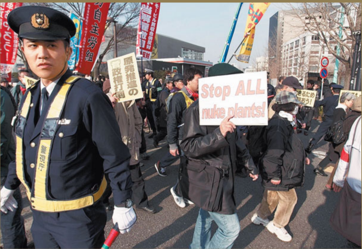
東京民眾昨日舉行反核遊行，呼籲全球停建核電廠。