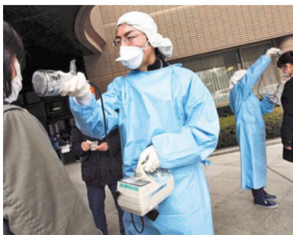
護理人員為從福島第一核電廠120公里範圍內撤出的災民檢測有否沾染輻射。