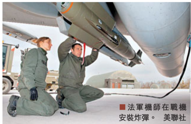
法軍機師在戰機安裝炸彈。

美、英、法等西方國家軍事干預利比亞，為設立禁飛區作準備。分析認為，禁飛區對於解決利比亞軍事衝突未必有太大作用，參與行動的國家對於軍事介入的程度也有分