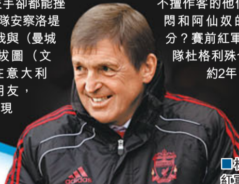
杜格利殊要重建紅軍王朝。

曼城近5次訪史丹佛橋4度落敗，但過去3次交手卻都能挫車仔，車仔領隊安察洛堤說笑道：「我與(曼城領隊)羅拔圖(文仙尼)在意大利隊時是朋友，但他現