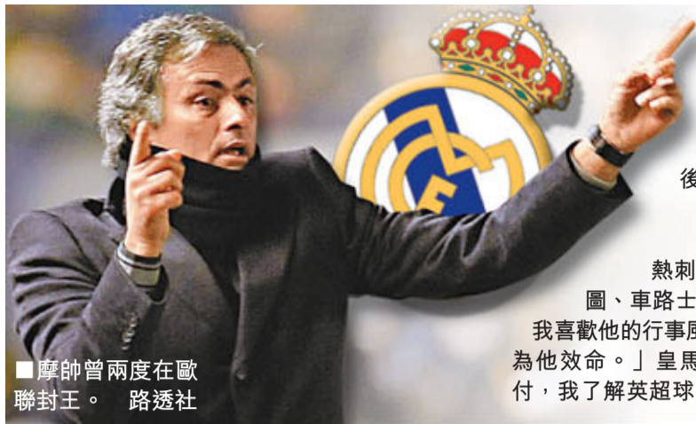
摩帥曾兩度在歐聯封王。