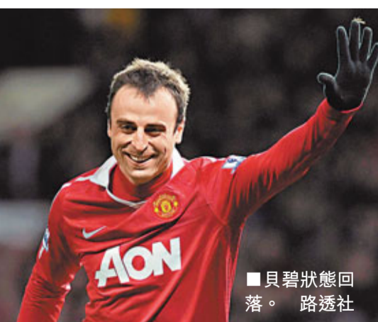
貝碧狀態回落。

另外，暫列英超榜首的曼聯將會進入魔鬼賽程。如果他們未能殺入歐聯4強，曼聯會在4、5月的26天內打5場重要比賽，其中歐聯兩門車路士、足總盃4強火併曼城，聯賽還要先後鬥愛華頓與阿仙奴。若然順利出線歐聯4強，曼聯26天內更會惡戰7場，成為紅魔最關鍵時刻。