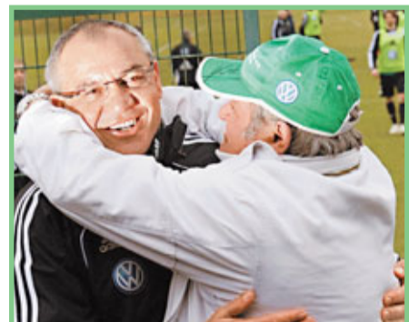
禾堡球迷歡迎馬加夫(左)回巢。

馬加夫被史浩克04解僱後重返2009年在其麾下首奪德甲冠軍的禾堡，這位名帥在今晚德甲要帶領於積分榜尾2掙扎的禾堡作客對3連勝後升上第14位的史特加。史特加受傷兵及停賽問題困擾，前鋒夏歷及後衛迪比亞停賽，門將比拿里奧也加入了波卡、卡卡奧、奧達爾及保拿奴斯等將的傷兵名單。史特加過去3季主場俱挫禾堡，但主帥巴拉迪亞卻說：「馬加夫將重燃禾堡鬥心，這對我們不是好事。」(有線61、64及202台周一凌晨12:30a.m.直播)