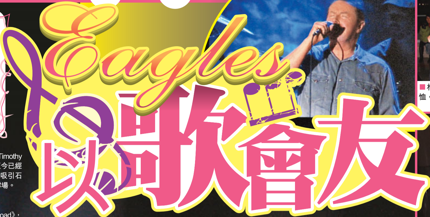
Don深情唱出《Desperado》。

香港文匯報訊(記者 陳敏娜)美國殿堂級傳奇樂隊Eagles前晚在香港會議展覽中心舉行「Long Road Out of Eden世界巡迴演唱會」香港站，吸引5000名樂迷朝聖。雖然他們最貴的門票超過2000元，但全晚唱了近3小時，比平時的外國band唱多1倍時間，他們更不時清唱、Jam樂器，以音樂回饋樂迷的精神，值回票價。