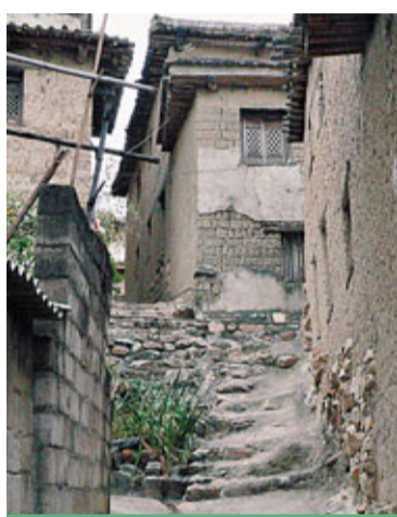
■土掌房間幽幽的古巷。

村中一條清幽的小河長滿了綠蔭的芒果樹，彎彎的鳳尾竹一直垂向水面，一名穿着傣裝的中年婦女說，要是夏天到那路村來，吃的、玩的就更多了。記者和這位婦女閒談中得知，她和另外6位婦女今天是來「出工」（工作的），其中2位是漢族裝扮的。她們每個人都有各自分工不同的着裝。有活動和過節時，村裡就會把留在家的婦女組織起來穿上民族服裝，表演節目或是與客人拍照，村裡給一定補貼。仔細看幾位婦女的傣裝，即使是像記者這樣第一次到訪的外來者也判斷得出，她們的傣裝大部分是市場上出售的舞台裝。