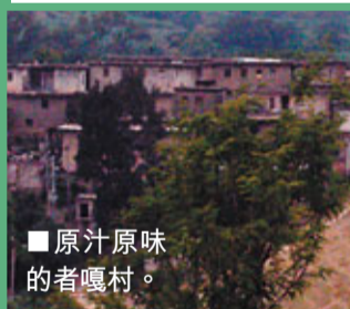
■原汁原味的者嘎村。

僅從村舍看，那路村已看不出是一個傣族居多的少數民族雜居村了，只是從村寨裡舉行公共活動的地方和偶爾在村中走着的老人的着裝能辨出點傣味。