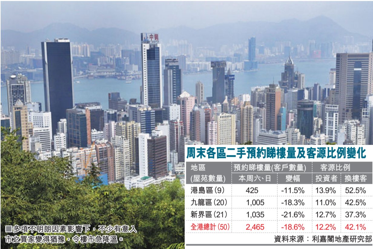
■多項不明朗因素影響下，不少有意入市之買家變得猶豫，令樓市急降溫。

中原地產住宅部亞太區董事總經理陳永傑表示，本周六、日中原十大屋苑錄1175組預約睇樓客，較上周期減少近12%。當中太古城睇樓量下跌11%至80組，每呎