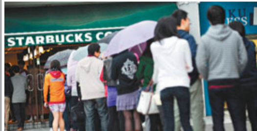
香港星巴克下午3至5點營業,為日本災區籌款,大批白領排隊購買。