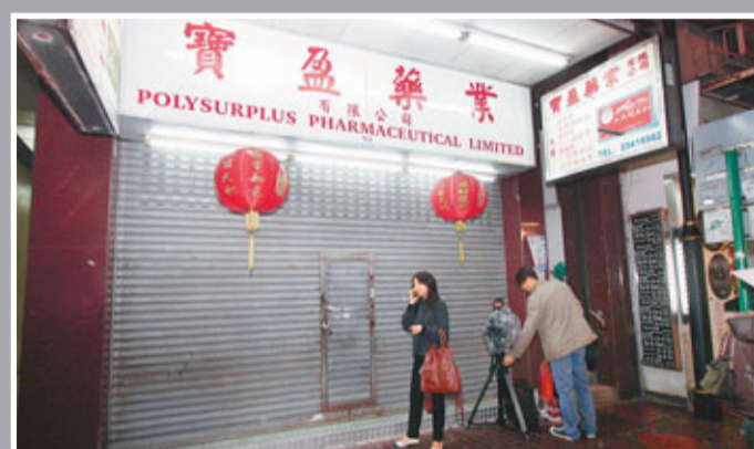
上環寶盈藥業疑將喉糖冒充碘片出售,當局考慮作出檢控。政府公布消息後,大批傳媒到場採訪,店員立即拉開。