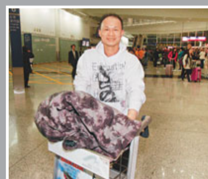
阮先生昨由東京返港,指當地秩序良好無混亂,覺港人表現緊張。