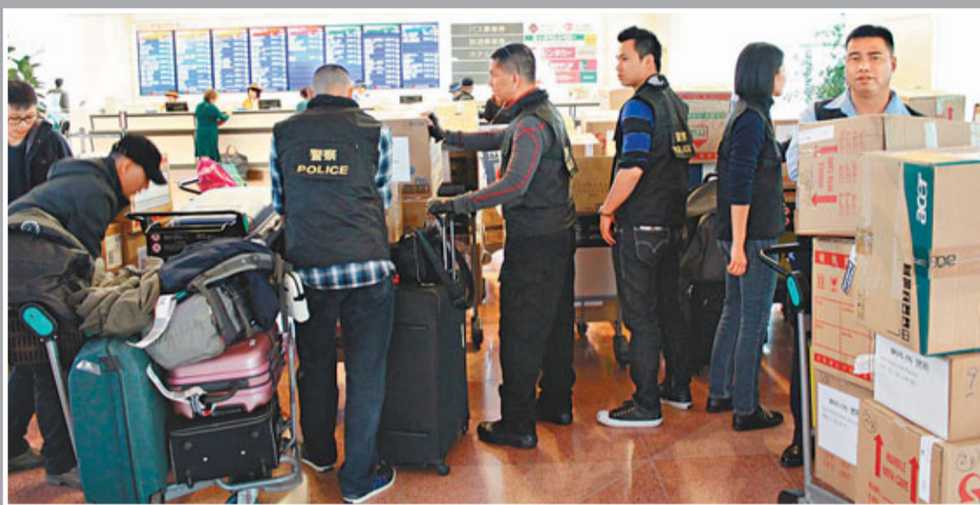
香港特區政府派出跨部門26人的支援隊伍抵達東京,協助港人撤離。

梁卓偉透露,昨日新增9,193箱日本奶粉到港,每箱約有6至8罐奶粉,當中包括不同牌子及適用於不同年齡幼童的奶粉,食物安全中心正與入口商、分銷商及零售商