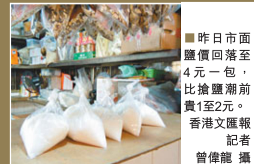
昨日市面鹽價回落至4元一包,比搶鹽潮前貴1至2元。

鹽價昨日回落,市面情況回復平靜。深水埗北河街街市的雜貨店負責人李先生表示,昨日食鹽來貨價為每85公斤120元,比平日的60至70元漲價近1倍,零售則為每包4元,比「搶鹽潮」發生前貴1至2元,生意亦與過往一樣。他表示,批發商抬價令鹽價