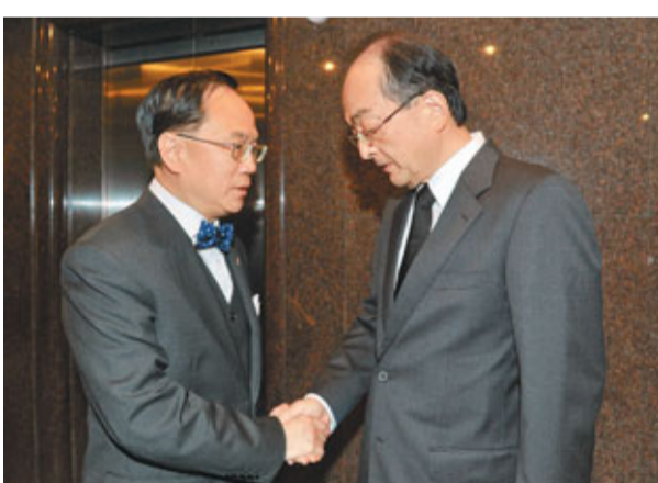
曾蔭權向日本駐港總領事隈久優次表達港人對震災和海嘯災民的深切慰問和祝福。

唐英年亦於昨日下午到日本駐香港總領事館簽署弔唁冊,對是次地震的遇難者表示深切哀悼。