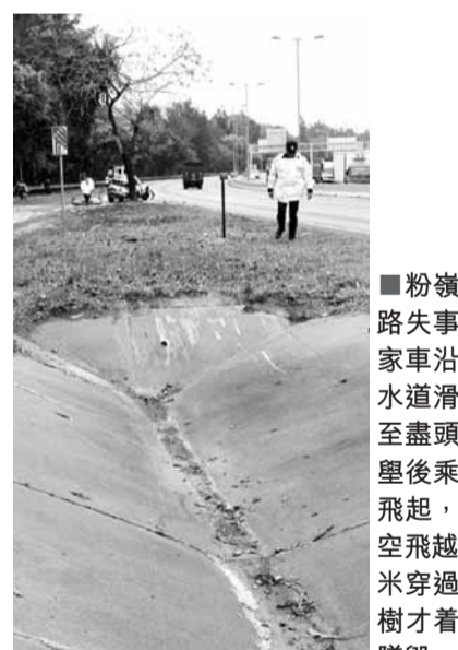
■粉嶺公路失事私家車沿去水道滑行至盡頭斜墜後乘勢飛起,凌空飛越30米穿過大樹才落地。

事發昨午12時49分,翁駕駛其私家車在落馬洲沿粉嶺公路往北水方向行駛,途至新田交匯處附近,在一右微彎處疑高速失控,撞入左邊支路之間分隔草坪,草坪內有一條2米闊、呈「V」字形的去水道,私家車沿去水道滑去,至盡頭斜墜乘勢飛出,恍如「炮彈飛車」凌空