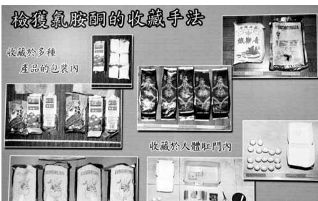
■犯毒集團將毒品以多種包裝掩飾,再以「螞蟻搬家」方法運毒回港轉售。

香港文匯報訊(記者 溫瑞麟、覃少林)海關毒品調查課根據情報,過去半年連續9次於港九新界及不同的陸路關卡,採取代號「獵狐」的掃毒行動,成功瓦解一個以「螞蟻搬家」形式,由內地走私K仔(氯胺酮)等毒品來港販毒的集團,共檢獲市值570萬元的K仔、五仔等毒品,扣留3輛充作毒品流動倉的私家車,12名男女被捕拘查。海關人員在行動中更揭發俗稱「豬仔」的毒品帶家,為逃避關員截查,罕見地以體內藏K方式運毒闖境。